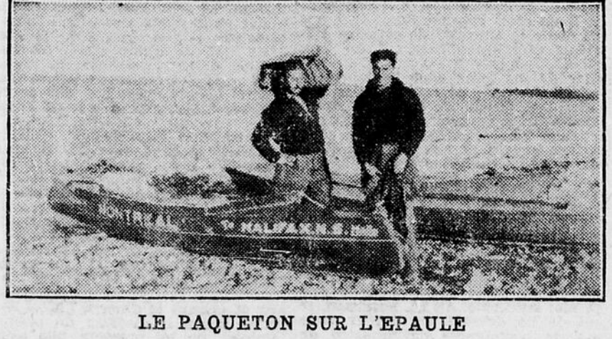
LE PAQUETON SUR L'ÉPAULE