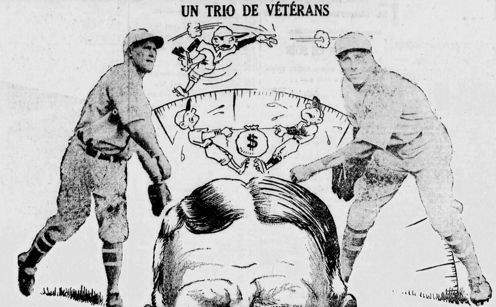
UN TRIO DE VÉTÉRANS