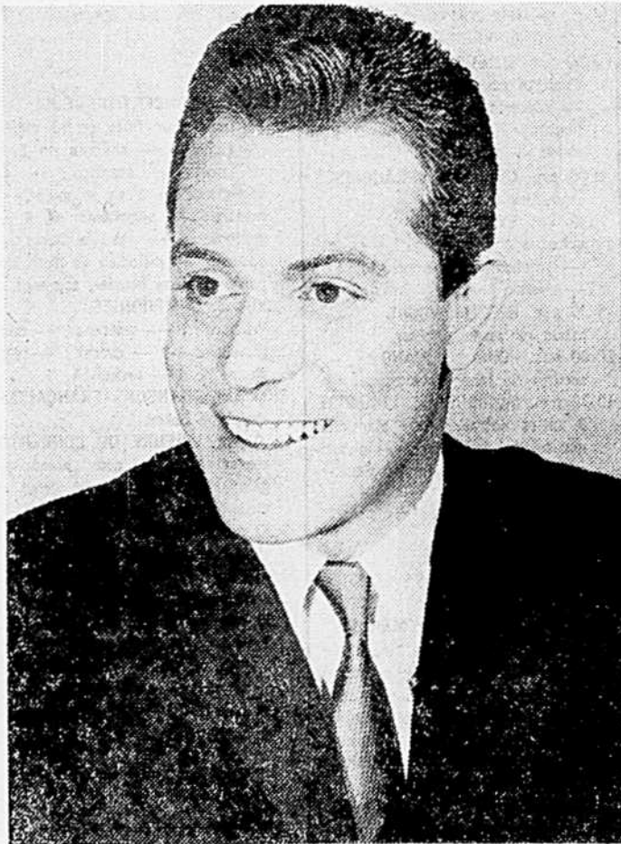
PAUL BURKE joue le rôle du détective Adam Flint dans la populaire série policière Cité sans voiles , tournée au coeur de New-York. Ces émissions d'une demi-heure, sont télévisées le mercredi soir à 8 h. 30 au réseau français de Radio-Canada.