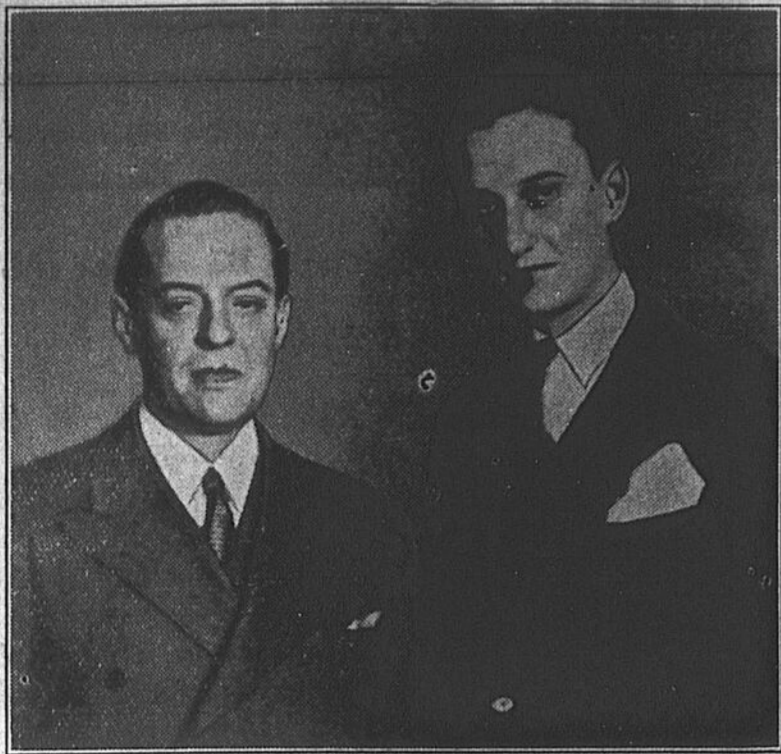
Messrs. JOHN De KUYPER & SON