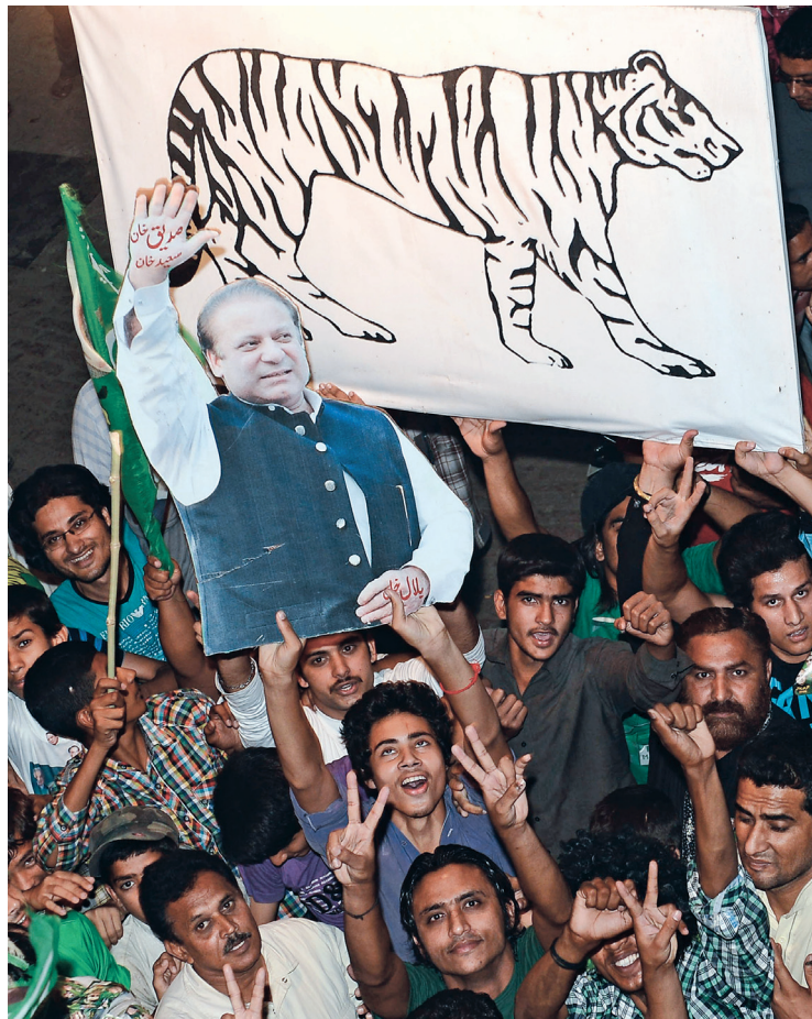
Même si les résultats n'ont pas encore été officiellement annoncés, des partisans ont célébré samedi soir l'élection de Nawaz Sharif comme nouveau premier ministre du Pakistan.

Les télévisions locales pronostiquaient pour les troupes de M. Sharif plus de 115 sièges sur les 272 députés élus directement. Suivent le Mouvement pour la justice (PTI)