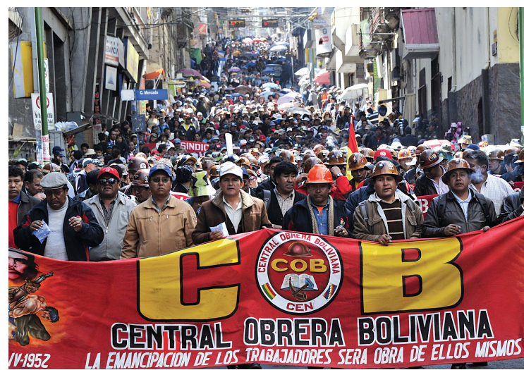
Des travailleurs marchaient le 9 mai dernier à La Paz lors de la quatrième journée de grève générale en Bolivie.

La COB avait annoncé samedi qu'elle était prête à mener des négociations tout le week-end avec le gouvernement et consulter sa base sur la proposition de trêve, mais les discussions n'avaient tou-