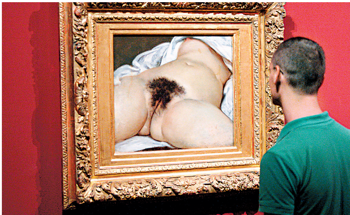
Des reproductions numériques de L'origine du monde , une toile controversée du peintre français Gustave Courbet, ont plusieurs fois été retirées par Facebook. Photo prise en 2008, à Montpellier, lors d'une exposition consacrée au peintre.

Ce document est utilisé par les quatre entreprises sous-traitantes de Facebook qui, dans le monde entier, surveillent vingt-quatre heures sur vingt-quatre les dérapages du réseau social, bien souvent à la suite de plaintes et de signalements — « cela représente 1%