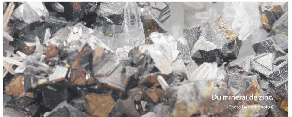
Du minerai de zinc.

Le claims est un bail qui lie son détenteur au gouvernement du Québec. Il donne le droit exclusif à celui qui le possède de rechercher des substances minérales sur le terrain concerné. Sa validité est de deux ans.