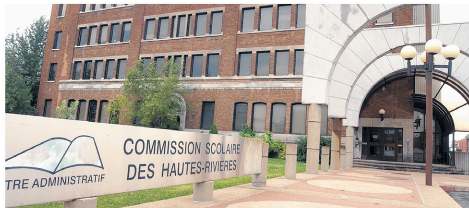
La Commission scolaire des Hautes-Rivières est déçue de la décision du tribunal. Elle s'attend à ce que l'équilibre budgétaire ne puisse être respecté.

Cette opération engendrera des coûts, mentionne-t-elle. Plus d'enseignants spécialistes devront aussi être embauchés.