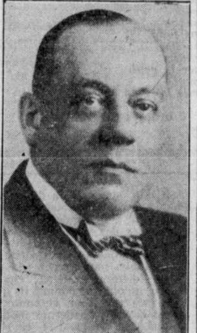
LE MAIRE CAMILLIEN HOUDE