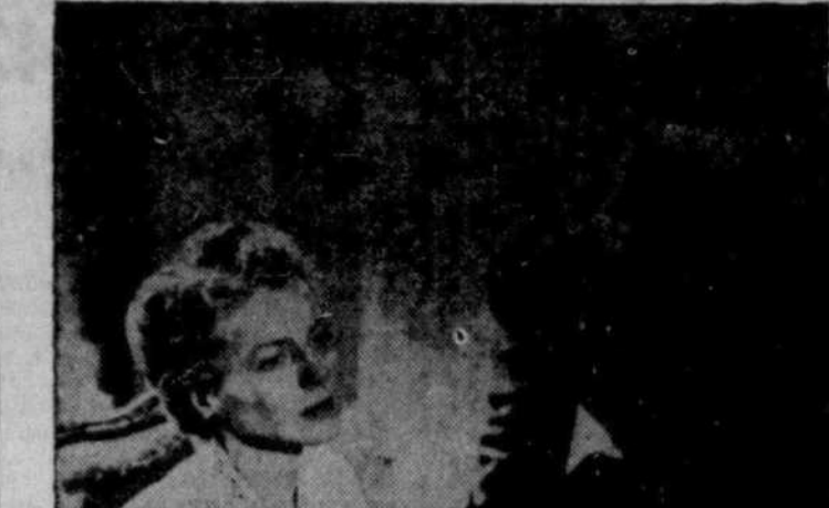
Renée Saint-Cyr et Noël Roquevert dans le film "Pierre et Jean", qui connaît un remarquable succès, cette semaine, au Paris.