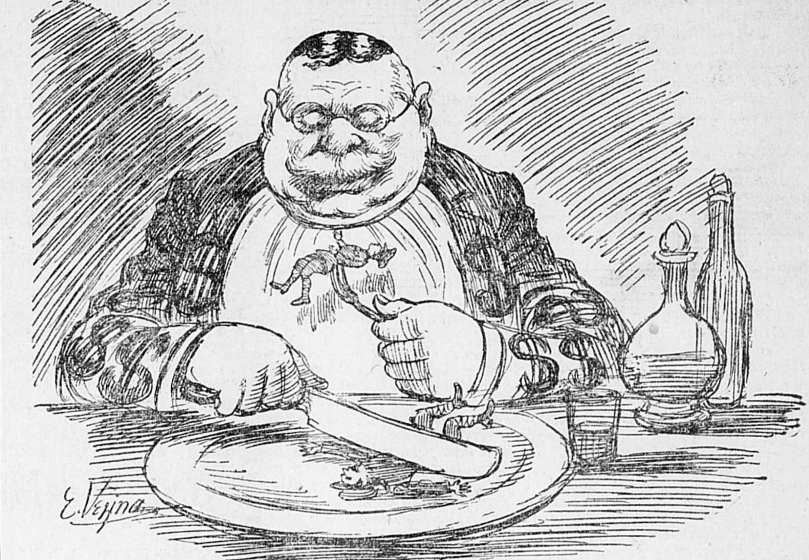
Ceux que les guerres n'ont jamais empêché de prospérer.

“Il y a 30,000 millionnaires nouveaux aux États-Unis, depuis la guerre.” — (New York Journal).