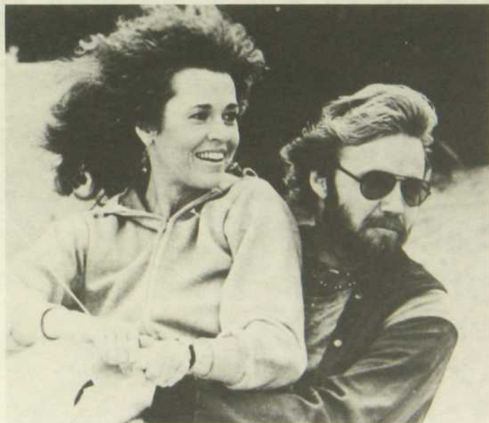
Jane Fonda et Jon Voight