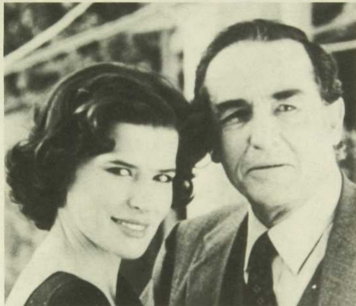
Fanny Ardant et Vittorio Gassman