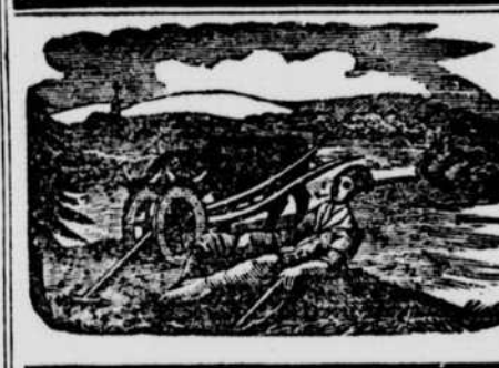
QUEBEC: VENDREDI, 2 OCTOBRE, 1835.

—Je reçois de nouveaux détails sur la destruction des couvens en Espagne. Un grand nombre de villes ont imité Saragosse et Barcelonne. On ne tue plus les moines, on les chasse des cloîtres à coups de bâton; puis, on met le feu aux bâtimens et sur leurs débris fumans, la vengeance populaire s'arrête. Cette destruction systématique s'opère sans effort et presque sans tumulte, les milices y assistent, l'arme au bras, et le gouvernement se borne à protéger la personne des moines.