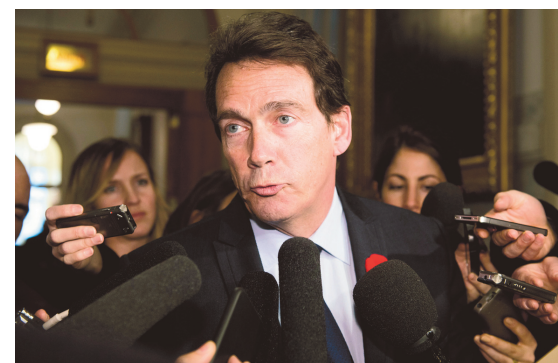
Pierre Karl Peladeau arrivant au caucus du PQ le 11 novembre