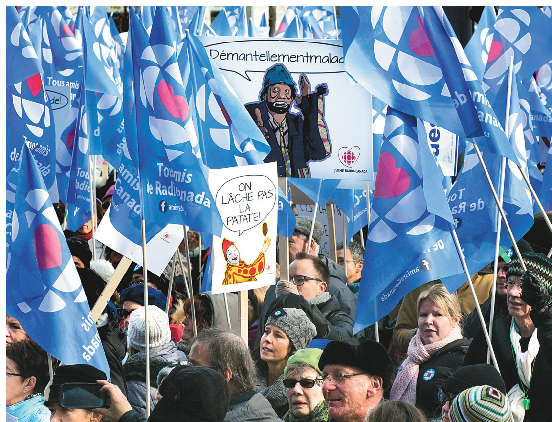
ANNIK MH DE CARUFEL LE DEVOIR

Les multiples compressions et l'annonce de la fermeture du costumier de la SRC ont poussé plusieurs milliers de personnes dans les rues dimanche, à Montréal (notre photo) et ailleurs au Canada.