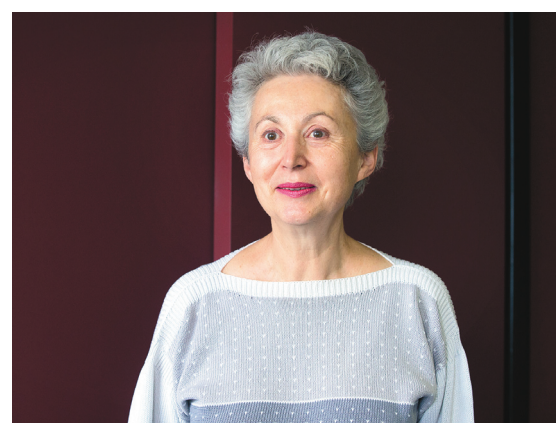
ANNIK MH DE CARUFEL LE DEVOIR

« Globalement, la meilleure stratégie est de tenir le temps qu'assez de filles arrivent aux études et dans les métiers, sinon, l'histoire est comme un accordéon. Chaque fois qu'on croit avancer, on peut recu-