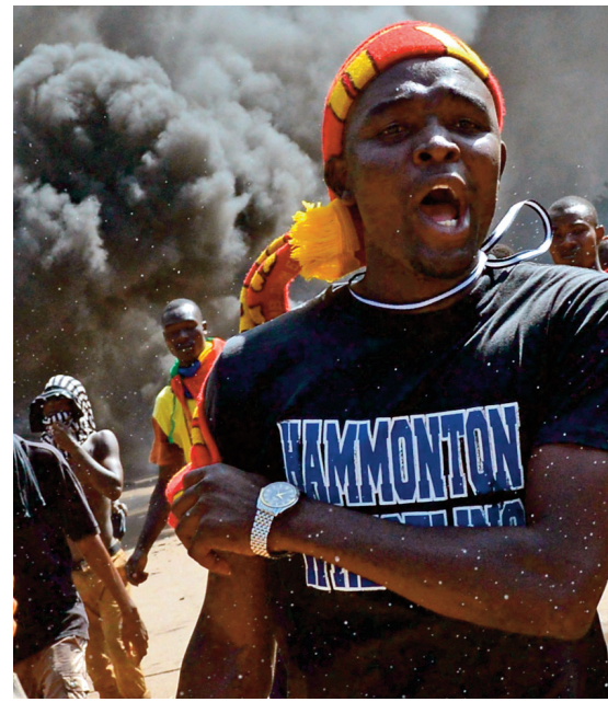
Manifestation à Ouagadougou, le 30 octobre

S'agissant alors de l'espoir que donnerait le départ du président Compaoré à d'autres pays en Afrique, il faudrait donc que soient présents, dans les pays concernés, les deux facteurs mentionnés, à savoir la sensibilisation de la population aux enjeux en présence comme aux défis à relever ainsi que l'implication des anciennes puissances dans le vent du changement.