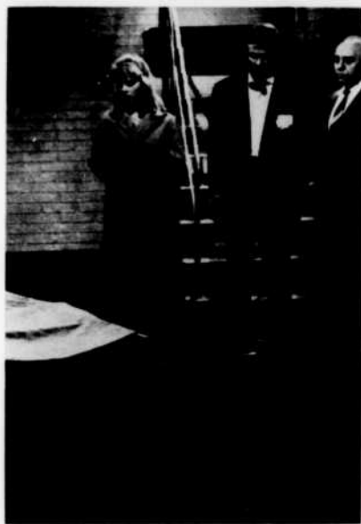
« Les Frenétiques »