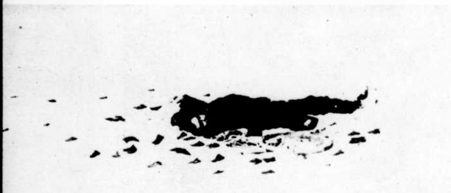
En Abitibi, on évoquera le souvenir de Siscoe, mort de froid entouré de ses dollars.

■ Le Bel Âge a toujours voyagé sur les ondes et dans le temps. Remontant jusqu'aux premières années de ce siècle à travers les souvenirs de ceux qui les ont vécues, le Bel Âge a voyagé sans cesse, faisant escale à tous les postes du réseau français de Radio-Canada.