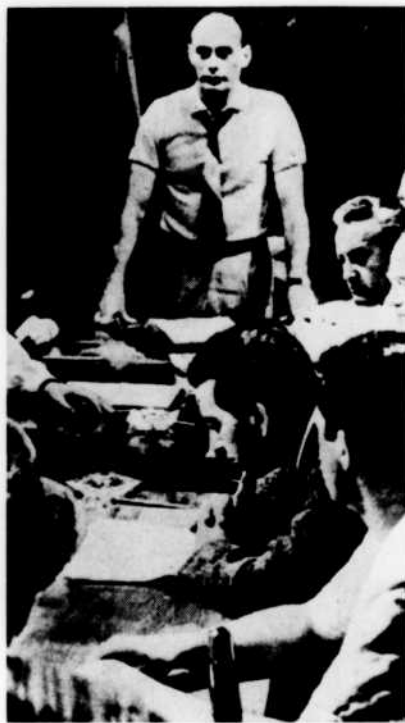
« Douze hommes en colère »