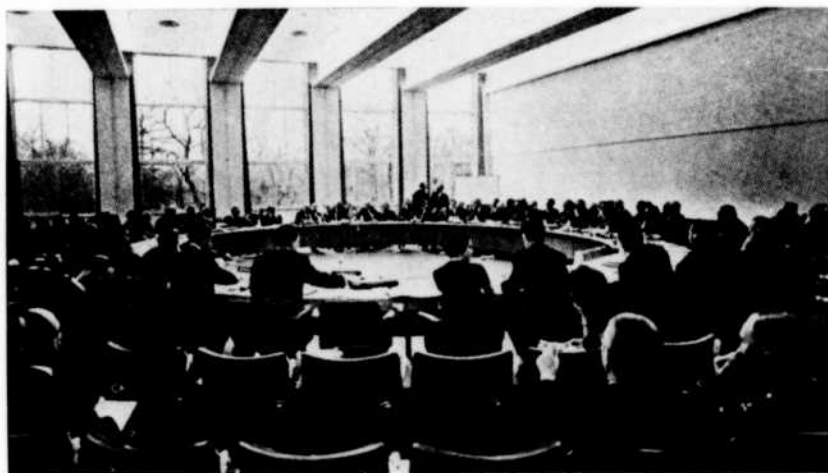
La table ronde du conseil de l'Otan

Rappelons que les pays qui participent à la réunion sont l'Allemagne de l'Ouest, la Belgique, le Canada, le Danemark, les États-Unis, la France, la Grèce, l'Italie, l'Islande, le Luxembourg, la Norvège, les Pays-Bas, le Portugal, la Suède et la Turquie.