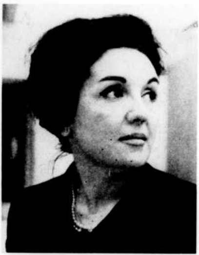
GLORIA LASSO chantera à l'émission En habit du dimanche, le 19 mai à 8 heures du soir, quelques-uns des refrains qui l'ont rendue célèbre.

Ce court métrage d'une demi-heure est le fruit de cinq ans de travail consciencieux.