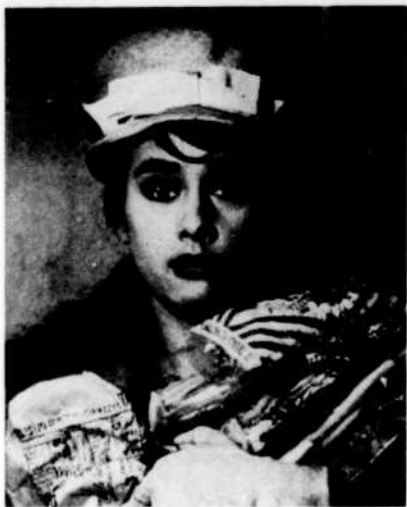
« La Danseuse et le bon Dieu »

■ Au cours de la belle saison, les téléspectateurs du réseau français de Radio-Canada verront à Cinéma international , le vendredi à 8 h. 30 du soir, une série de films qui, tout en justifiant par leur origine le titre sous lequel ils sont présentés, constituent un choix exceptionnel de comédies, d'histoires policières et de drames, interprétés par des vedettes du cinéma et des comédiens de grande classe. Quelques noms et quelques titres donneront une idée de la variété et de la qualité des films choisis pour la période du 24 mai au 4 octobre.