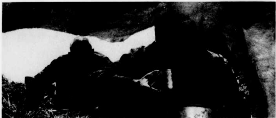
« La Vache et le prisonnier »