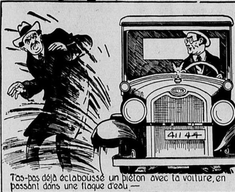
Tas-tas déjà écaboussé un piéton avec ta voiture, en passant dans une flaque d'eau —