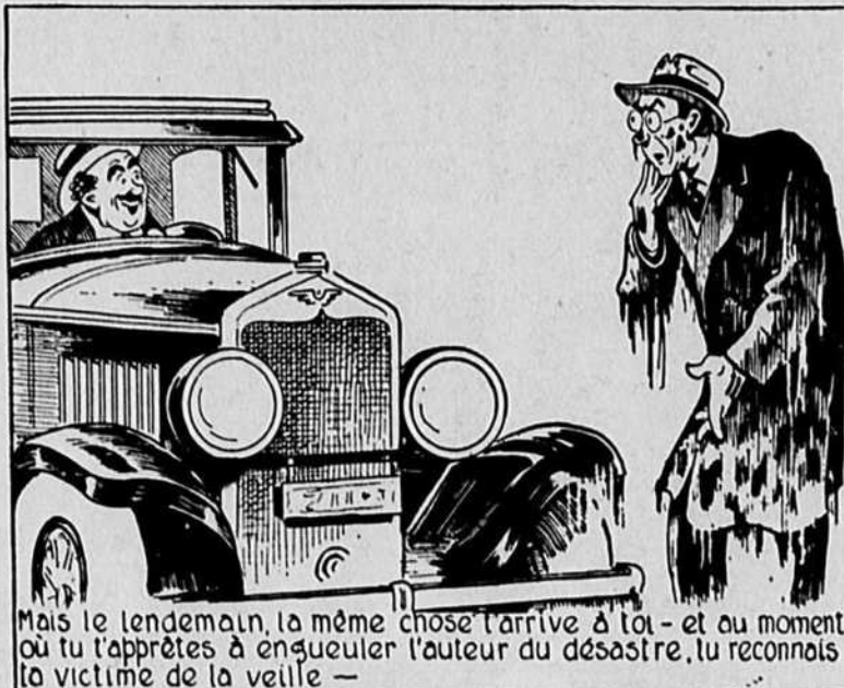
Mais le lendemain, la même chose t'arrive à toi - et au moment où tu t'appêtes à enquereler l'auteur du désastre, tu reconnais la victime de la veille —