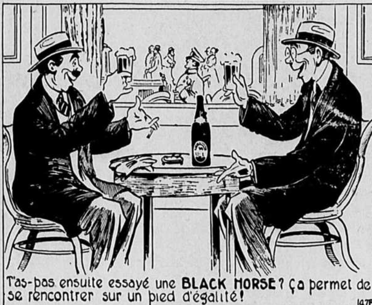
Tas-tas ensuite essayé une BLACK HORSE? Ça permet de se rencontrer sur un pied d'égalité!