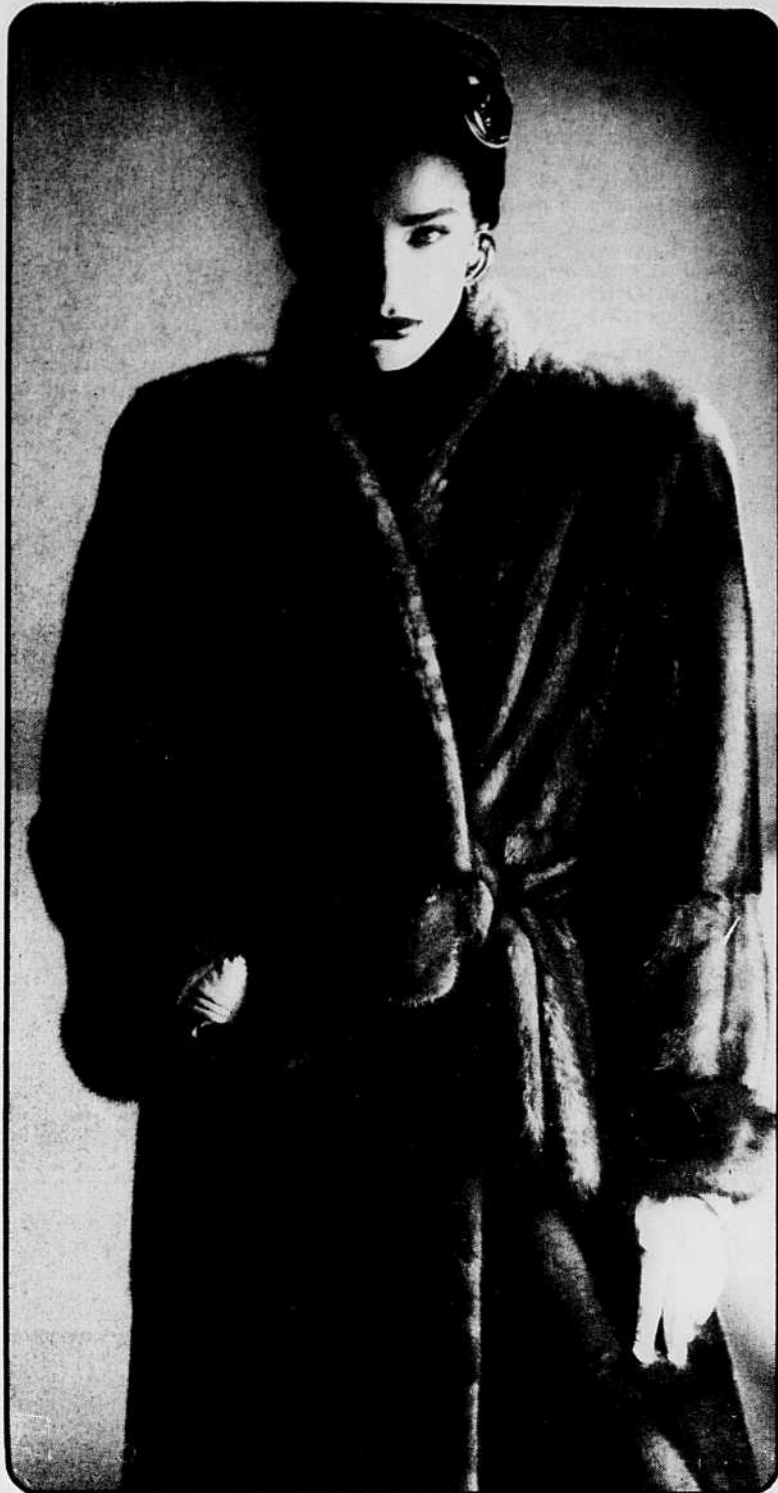
D'allure citadine, manteau long, ceinturé, en vison pleines peaux, coloris demi-sang. Le petit col officier et les revers aux manches en font un manteau facile à porter.

Pour l'hiver 88-89, la collection de fourrures MICHEL ROBICHAUD joue la carte des valeurs sûres, du luxe raffiné. L'humeur du moment donne raison à une mode créative mais sans excès, aux silhouettes repropotionnées, aux belles peaux, aux coupes irréprochables, à la qualité qui rime si bien avec féminité. Féminité des manteaux qui jouent le sport ou l'habillé. Féminité des vestes longues qui se portent sur jupes ou pantalons. La fourrure vedette de la saison Robichaud? Le vison... parce que, explique le couturier, cette fourrure dense et légère, au poil brillant et lustré, se prête bien aux fantaisies de la création. Pour sa part, le vapoureux renard teint, dans des coloris modernes, fera la joie des plus extravagantes. Le castor, aux qualités exceptionnelles qu'il soit rasé ou long poil, joue lui aussi la mode sur tous les tons. Enfin, le raton laveur effectue un retour en force. Plus attrayant que jamais, il devient très raffiné lorsque les peaux sont traitées à l'horizontale. Les couleurs sont incroyables: blanc immaculé pour un castor rasé, bleu électrique pour un vison mâle, rouge vin pour un renard. Pour sa collection hivernale, Robichaud déploie deux silhouettes qui effectuent un chassé-croisé de charme. La ligne droite joue avec la ligne ample, manteaux et vestes longues suivent la courbe du corps. Les épaules suffisamment proportionnées deviennent moins agressives, les manches s'amenuisent et... le long joue toujours le premier rôle.