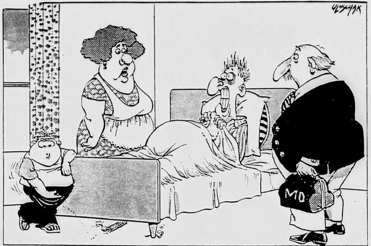
Je lui avais pourtant dit de ne pas suivre d'aussi près cette campagne électorale!