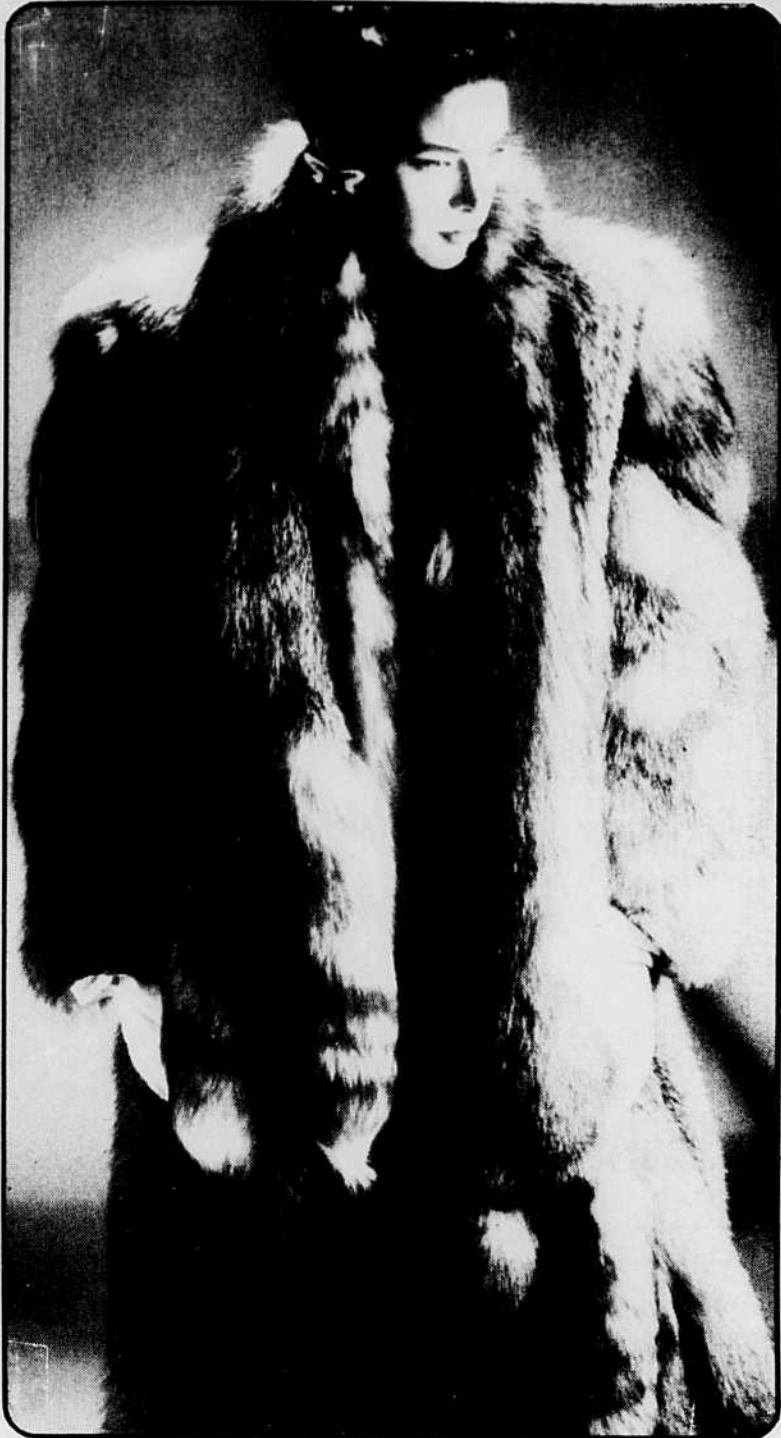
Manteau long, agrémenté d'un boa amovible, en renard teint lynx. Les manches sont traitées en torsade. Les bijoux sont également signés Robichaud.