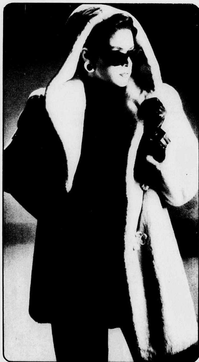
Veste trois-quarts, avec capuchon, en castor rasé, coloris blanc cassé. D'allure sport, cette veste peut se porter avec pantalon ou avec jupe.