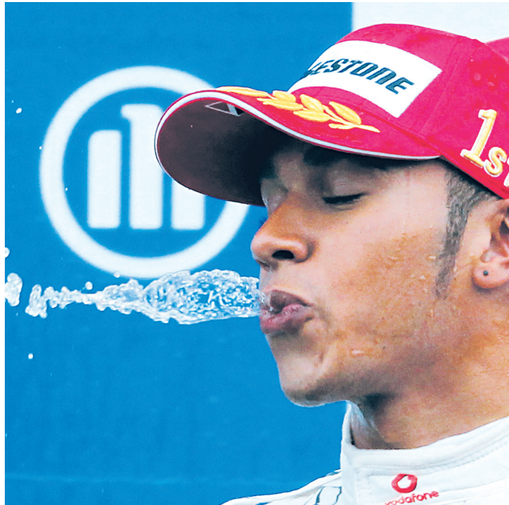
Quand le champagne coule à flots: Lewis Hamilton célébrant sa victoire hier au Grand Prix de Belgique.