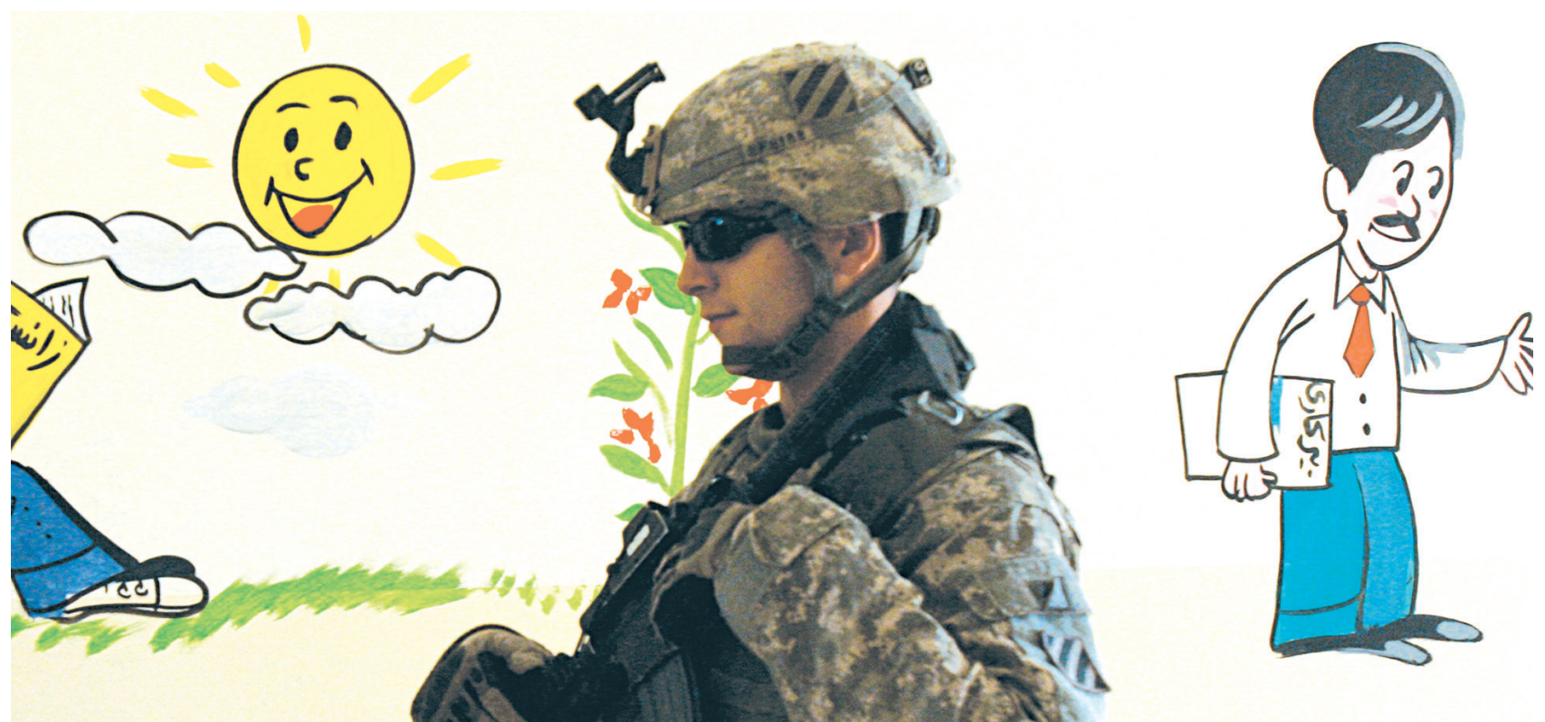
Un soldat américain dans une école au nord de Bagdad, hier.

François Brousseau est chroniqueur d'information internationale à Radio-Canada. On peut l'entendre tous les jours à l'émission Désautels à la Première Chaîne radio et lire ses carnets dans www.radio-canada.ca/nouvelles/carnets . francobrousseau@hotmail.com