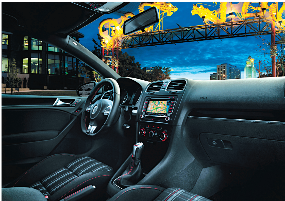
Deux boîtes de vitesses sont offertes, toutes deux à six rapports: une manuelle et la boîte DSG à passage direct.