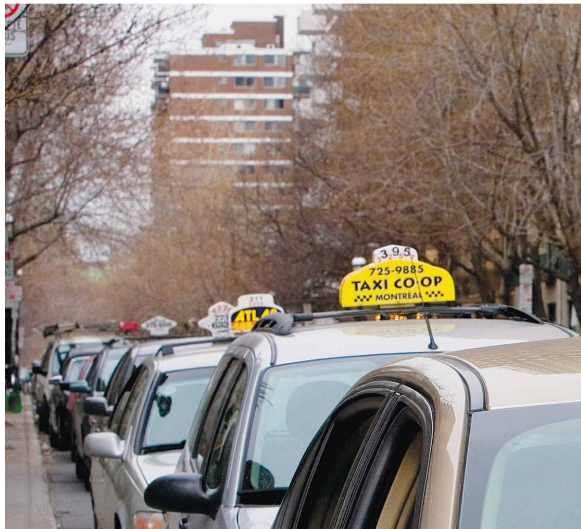
ANNIK DE CARUFEL LE DEVOIR

En 2010, les propriétaires et chauffeurs de taxi sont en très grande majorité des immigrants, particulièrement dans la région montréalaise et de plus en plus aussi dans celle de Québec. En fait,