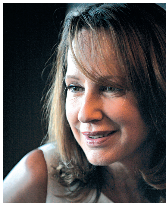
La présidente du jury du Festival d'Angoulême, Nathalie Baye