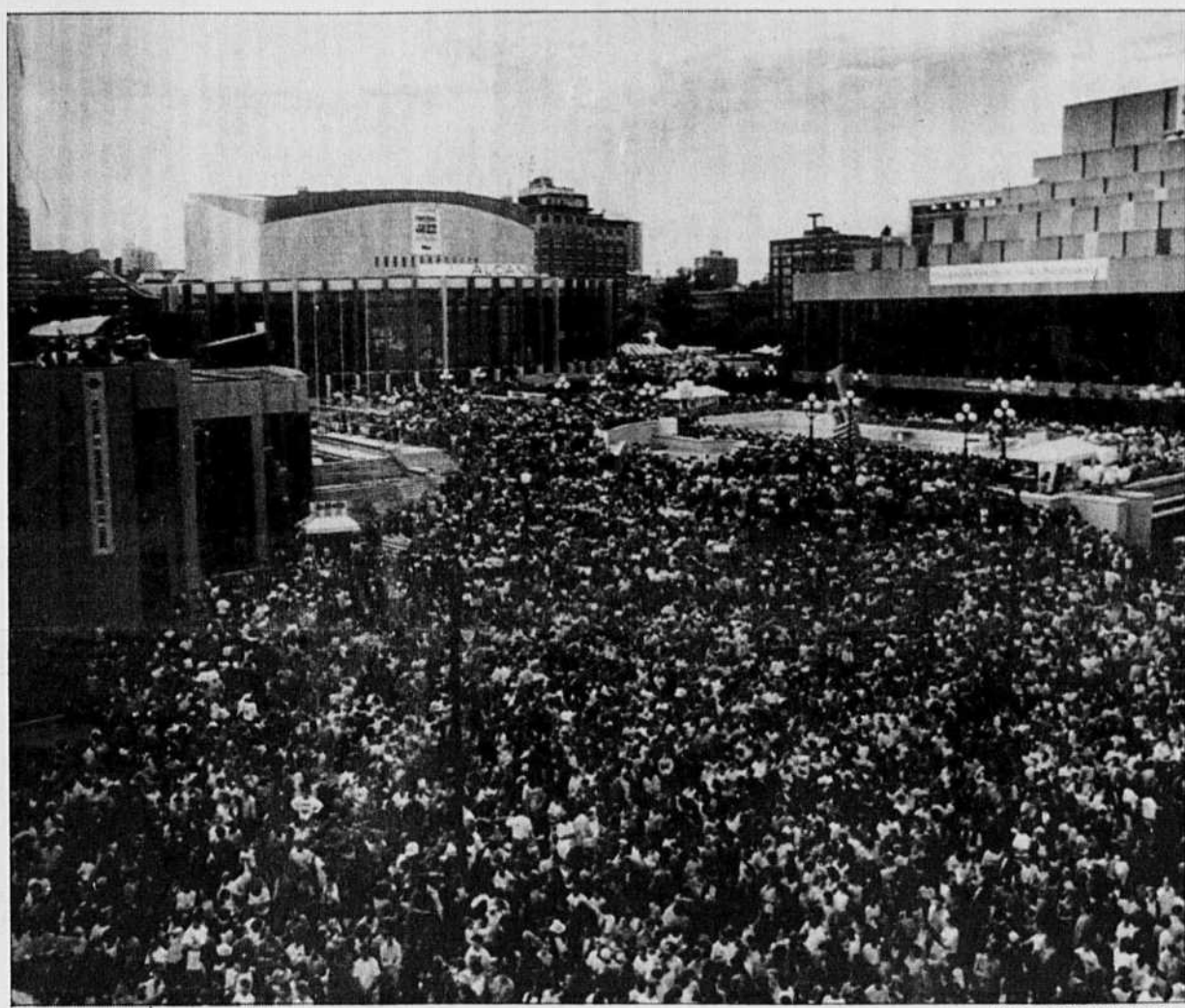
De 60 000 qu'ils étaient avant même que le spectacle commence, les admirateurs d'Uzeb se chiffraient par 90 000 à 23h, au plus fort de la tourmente musicale qui secouait, hier soir, la grande scène montée aux abords de la Place des Arts.