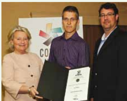
1-Le Domaine Ives Hill

4-Les Comptonales , lauréat des Grands prix du tourisme des Cantons-de-l'Est 2012, a été sélectionné parmi les finalistes pour les Grands prix du tourisme du Québec, toujours dans la catégorie « Festivals et événements touristiques : budget d'exploitation de moins de 300 000 $ ». Les lauréats seront connus le 28 mai prochain lors d'une soirée qui se déroulera au Centre de foires de Sherbrooke.