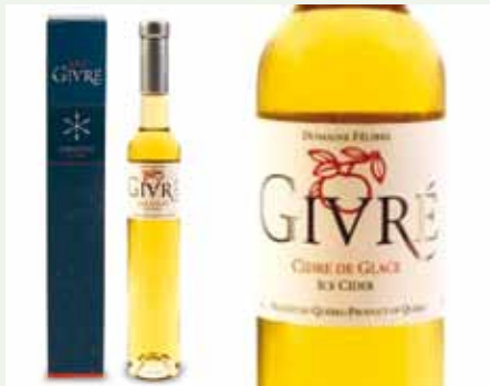
3-Le Domaine félibre