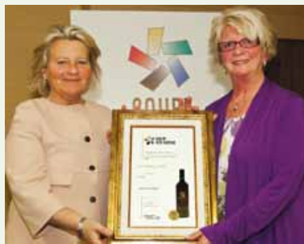
2-Le vignoble Coteaux du Tremblay