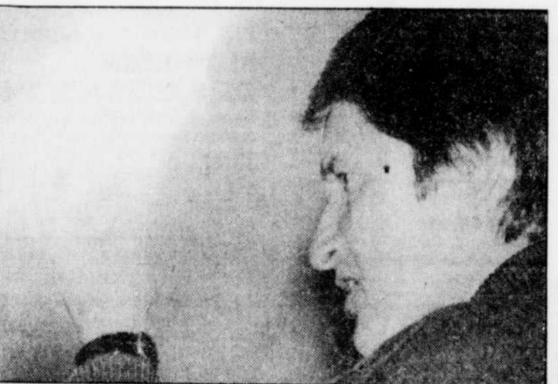
Le chef Ovide Mercredi s'adressait, hier, à la conférence sur le suicide chez les jeunes autochtones. La photo ci-dessus pourrait faire dire au chef des Premières nations: « Que la lumière soit! ».

À la fin de janvier, six enfants innu de Davis Inlet, petite commu-