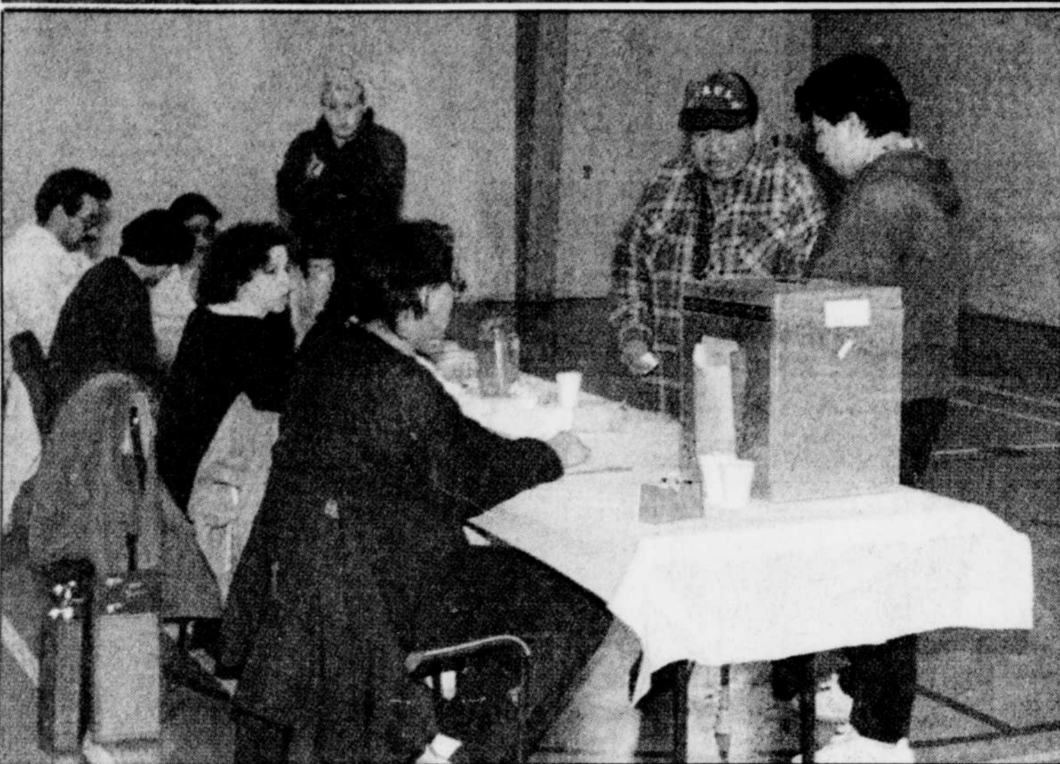
Le taux de participation aux élections de lundi s'est établi à 69,7 % à Uashat et à 37,3 % à sa réserve soeur de Mani-Utenam.