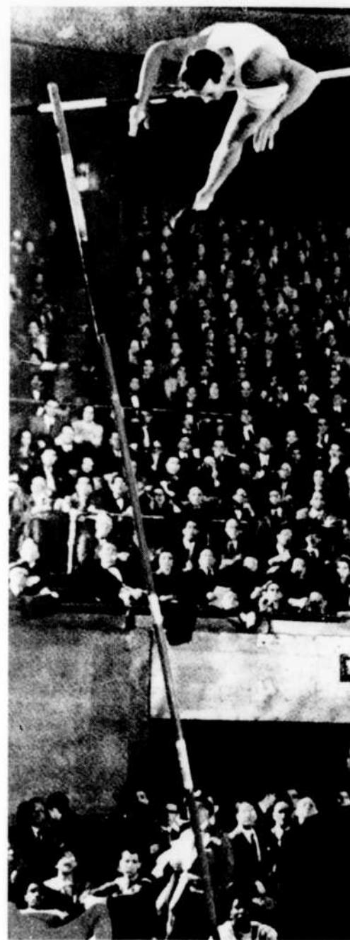
Exploits sportifs, une nouvelle série d'émissions télévisées le lundi soir, de 7 h. 45 à 8 heures, à compter du 23 juillet.

Cette série de dix émissions sera commentée par notre populaire animateur sportif René Lecavalier.