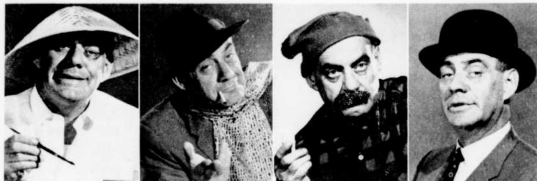
Quelques-uns des personnages créés par les scripteurs réguliers de Chez Miville. Serez-vous les créateurs d'autres personnages?