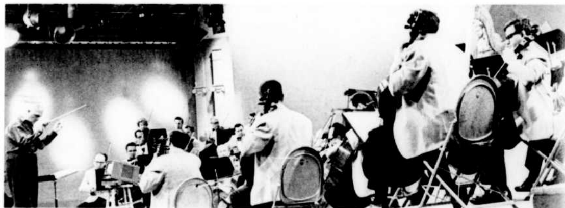
L'orchestre de «Sérénade estivale»