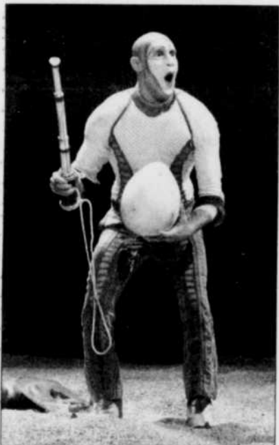
L'homme et l'œuf de tortue...

Le créateur de marionnettes invente une faune amicale pour KÀ