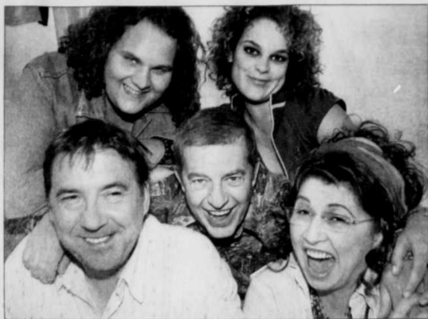
Antoine Bertrand, Hélène Bourgeois-Leclerc, Rémy Girard, Claude Laroche et Louison Danis : les Bougon partent en bonne position pour les MetroStar.

■ Cette semaine, Patrice L'Écuyer reçoit Marie-Josée Taillefer, qui sera surprise par la personne qu'on lui a dénichée. Les chercheurs ont fouillé partout en Italie pour retracer un homme qui a aidé l'animatrice de L'Épicerie il y a plusieurs années. Marie-Hélène Thibault, la Solange de Providence, sera étonnée de croiser de nouveau une jeune fille qui a fait preuve d'une grande patience envers elle. Incroyable. Qui l'eût cru! , Radio-Canada à 20 h.