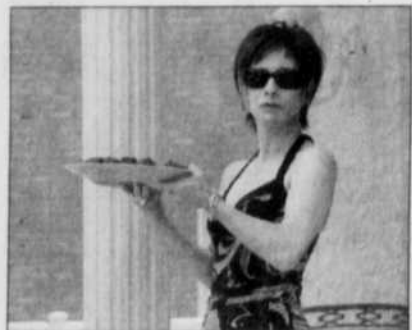
Sylvie Léonard dans « Vice caché »

■ Enfin ! C'est la première émission ce soir du soap le plus délectant des ondes. Le cœur a ses raisons , qui met en vedette Marc Labrèche et Anne Dorval, débute cependant avec un drame épouvantable. À Saint-Andrews, le milliardaire Doug Montgomery (Albert Millaire), père des jumeaux Brett et Brad (Marc Labrèche), s'éteint dans son somptueux manoir. Cette mauvaise nouvelle survient quelques minutes après que Brett, médecin au grand cœur, lui eut annoncé son départ pour l'Afrique. Pendant ce temps-là, sa fiancée Cricket Rockwell (Anne Dorval) a du mal à avouer à Ridge Taylor (Pierre Brassard) qu'elle fréquente un autre homme. Un incident tragique viendra brouiller encore plus les cartes. Le cœur a ses raisons , TVA à 20 h.