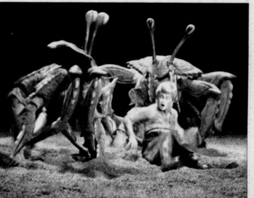
Des crabes pour le moins impressionnants.

LE SOLEIL est l'inédit du Cirque du Soleil à Las Vegas.