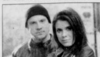
Claude Legault et Julie Perreault dans « Minuit, le soir », mercredi, 21 h 30, à Radio-Canada.