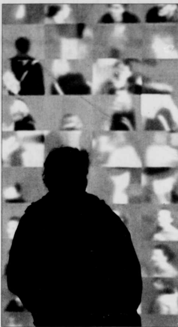
Spectateur devant une partie de « Taken »

PRÉSENTATION SPÉCIALE SAMEDI LE 5 FÉVRIER À 19 H