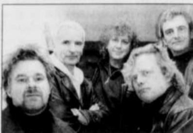
Les membres de Saga