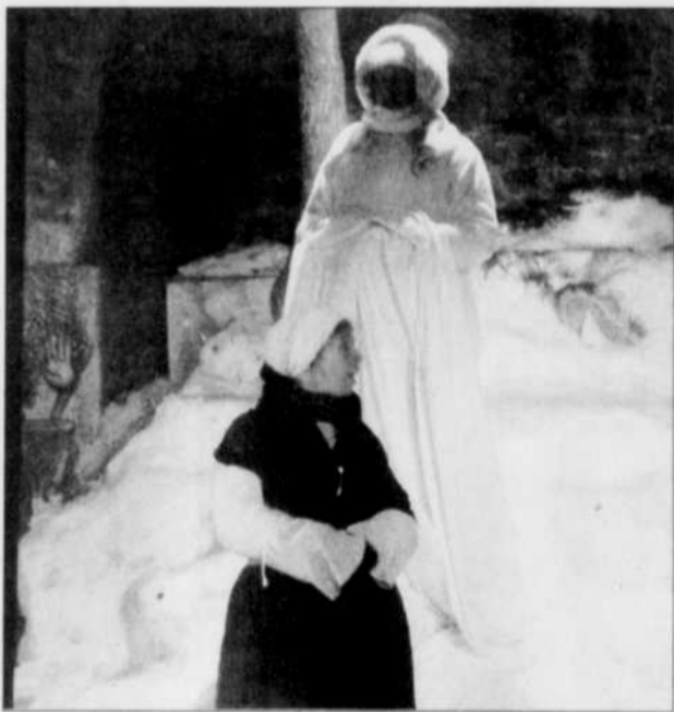
Une pièce qui se joue dans la neige...

Les comédiens interprètent au moins deux rôles chacun (le texte original prévoit une vingtaine de rôles, à tout le moins). Cette approche distanciée, l'imagerie carnavalesque, l'usage d'expressions et d'une chanson à répondre bien d'ici achè-