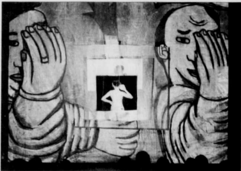
« White Cabin » a notamment recours à l'intégration de la vidéo.

tions, dans les images. On joue l'eau contre le feu. La rencontre de l'homme et de la femme est problématique, la séduction voisine la répulsion. La vitalité fait piètre contrepois à la destruction, si ce n'est à l'effacement.