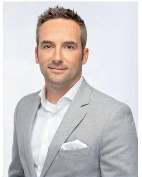
Le maire de Mirabel, Patrick Charbonneau, espère que ses concitoyens profiteront adéquatement de la période des fêtes.