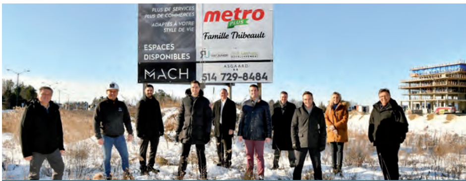
La construction du nouveau Metro Plus débutera au printemps 2022. Le supermarché devrait ouvrir ses portes en novembre.