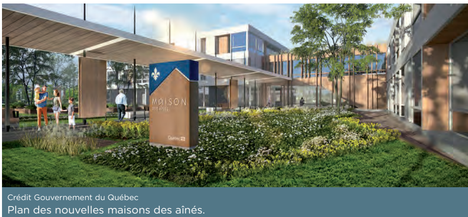
Plan des nouvelles maisons des aînés.