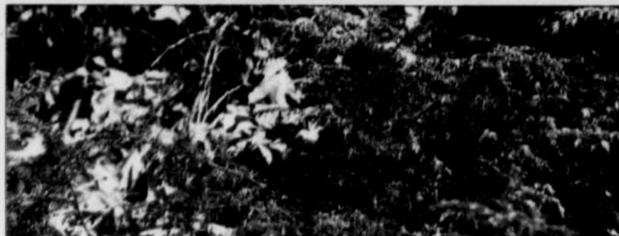
L'if du Canada