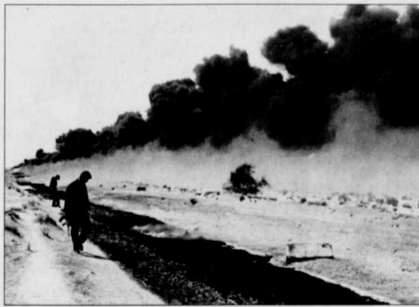
La jeune Stéphanie Bacon déplore que le pétrole soit une source de conflits.

La mondialisation économique comporte aussi son lot de risques. Une