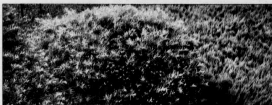
L'if du Japon