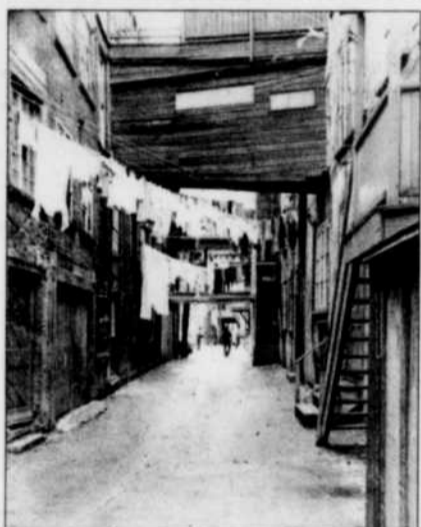
La rue Sous-le-Cap autour de 1970

Les premières demeures de la rue étaient collées sur le cap. Jusqu'à ce que des éboulements de plus en plus nombreux et de plus en plus meurtriers forcent à les reconstruire à environ 15 mètres plus loin et à produire cet