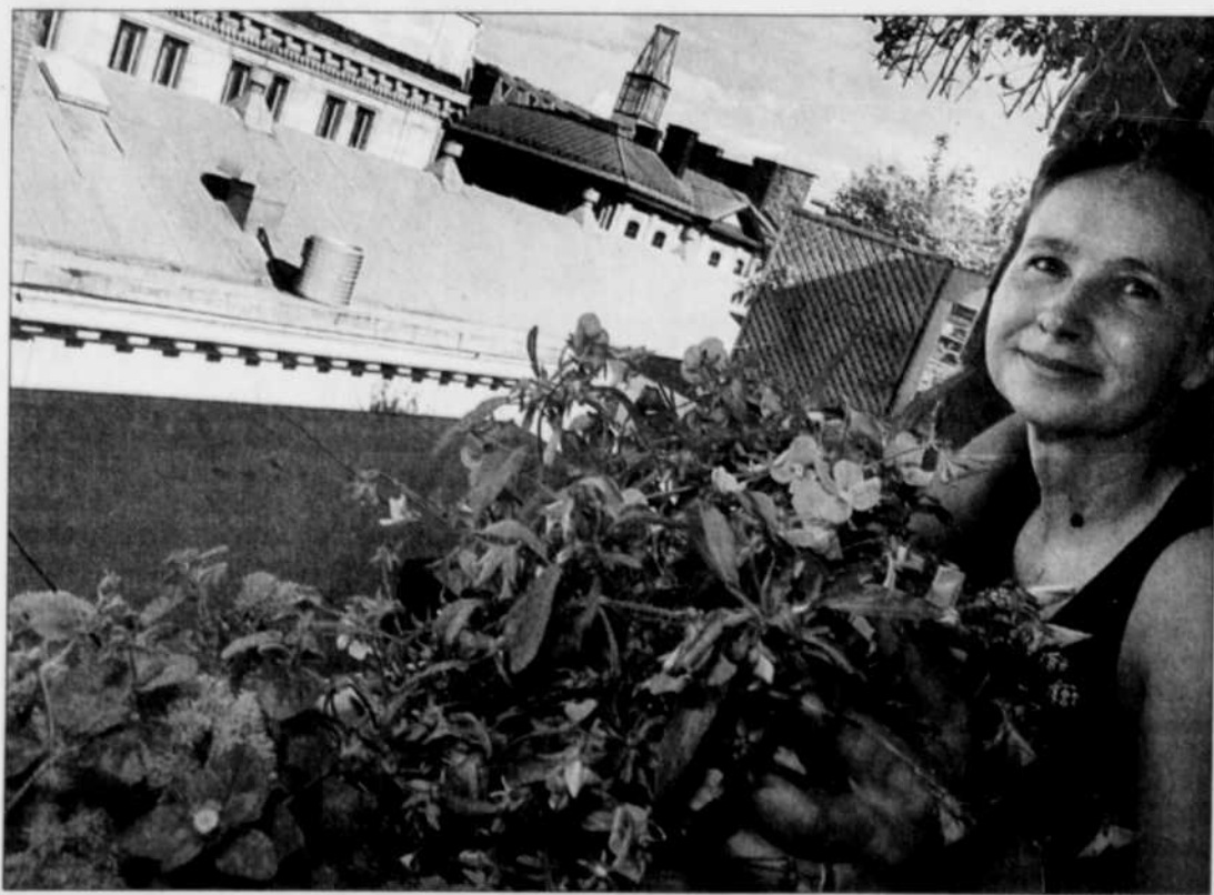
LE SOLEIL - ERICK LABRE La peintre sculpteur parle de sa terrasse avec poésie. « Les odeurs montent, les bateaux hurlent, dit-elle. Les oranges sont magnifiques du côté du cap. Et quand ils font s'en détacher de gros morceaux de pierre, j'en deviens tout excitée ! »

Pour Rino Lévesque, c'est là une reconnaissance du chemin parcouru depuis cinq ans. « On parle d'une école primaire publique, qui se bat contre des écoles beaucoup plus grosses et souvent privées », prend-il soin de souligner.