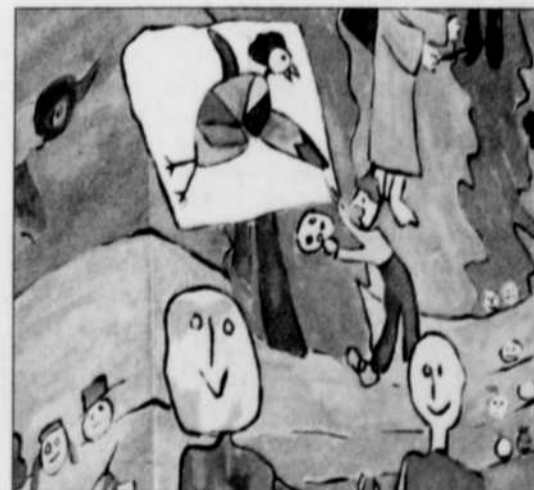
Un détail de la fresque

Cela donne des classes décloisonnées, des