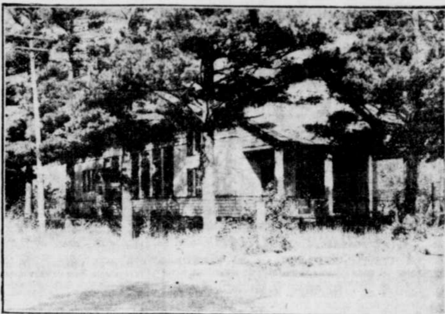
LE LOCAL DES CHEVALIERS — La photo ci-dessus nous fait voir le local du Conseil 1254 des Chevaliers de Colomb de Victoriaville, situé au coin des rues St-Augustin et Monfette.

La Tribune, Sherbrooke, vendredi, 21 octobre 1949 Page 13