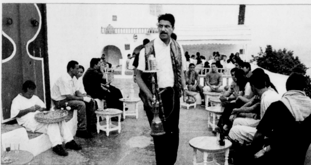
Une rue du village de Sidi Bou Said, situé tout près de Tunis.

■ L'Office national du tourisme tunisien et Air France organisent, en collaboration avec le Château Frontenac et l'hôtel Sidi Bou Said de Tunis, trois journées gastronomiques tunisiennes, du 23 au 26 janvier. À cette occasion, un déjeuner de presse est prévu au Salon rose, le jeudi 23, suivi d'un souper, le même soir, en présence de l'ambassadeur de la Tunisie au Canada, Mohamed Saas. Si vous avez déjà visité la Tunisie, c'est l'occasion de vous y replonger à moindres frais, pour y redécouvrir sa gastronomie, son folklore et ses danses. Si vous n'avez jamais mis les pieds dans ce pays d'Afrique du Nord, c'est le temps de découvrir ce qu'il peut vous offrir en participant au moins une fois aux activités culinaires de cette fin de semaine gastronomique.