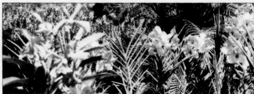
En plus de ses 180 kilomètres de plages de sable fin, l'île offre aux visiteurs bien d'autres attraits, comme ce jardin d'orchidées.

mande le taxi, car il y a beaucoup de monde sur la route). Et dans certains hôtels de la côte ouest, on prend encore le thé en après-midi. L'île, en forme de poire, est située à l'extrémité est des Antilles. Longue de 33 kilomètres et large de 22 kilomètres, à son maximum, la Barbade est l'une des îles les plus peuplées, avec 268 000 habitants. Disons qu'il y a beaucoup de monde au kilomètre carré! Elle profite d'un climat tropical à l'année et offre aux visiteurs 180 kilomètres de plages de sable fin... « Et toutes ces plages sont publiques! » s'empresse de nous dire Wendy, notre chauffeuse de taxi, dès notre descente de l'aéroport. Wendy n'a pas mis les pieds sur une plage depuis huit ans. Une exception? Pas du tout. Il semble que les gens de la Barbade ne remarquent plus ces