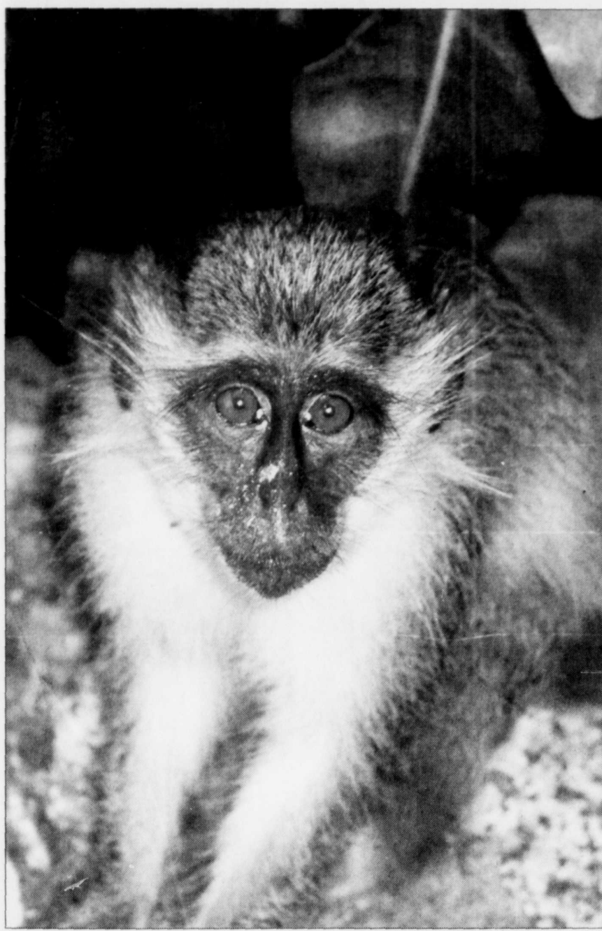
Un singe vert, dont les reins sont utilisés pour fabriquer des vaccins contre la polio. Originaire du Sénégal, le primate a été amené dans l'île il y a 350 ans; on en compterait entre 5000 et 10000 aujourd'hui.

Si vous êtes en voiture et que vous pouvez vous déplacer librement, vous pourrez aussi faire une visite guidée