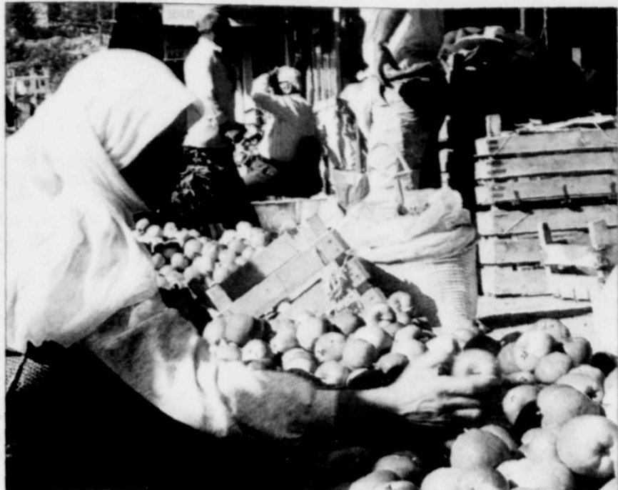
La Turquie est une destination jugée très abordable.