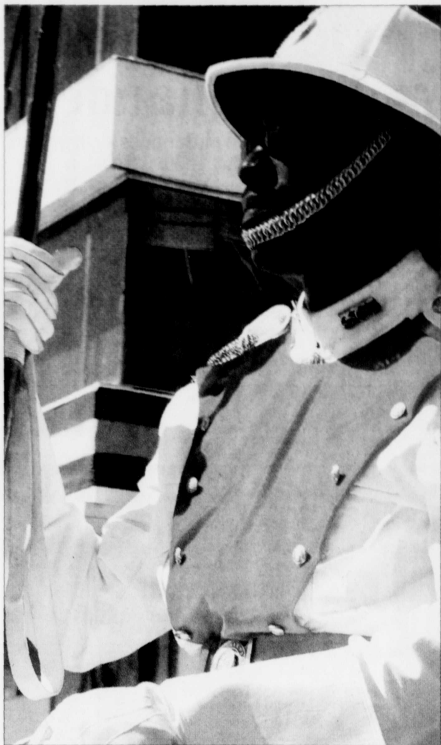
Un policier monte la garde dans le port de Bridgetown.

L'île a compté jusqu'à 1200 grandes plantations