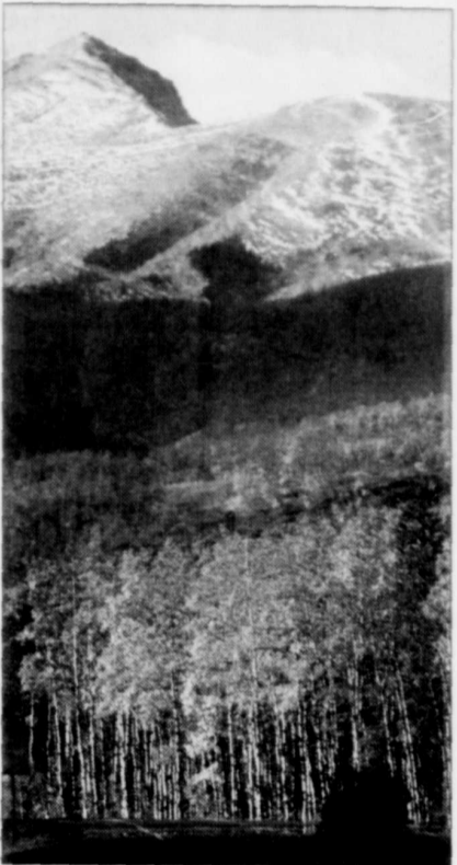
Les personnes qui souffrent de maladies coronariennes ou d'insuffisance respiratoire devraient éviter les excursions en haute altitude.

■ PARIS (AP) — Vous partez en vacances vers des pays de montagnes? À partir de 2500 m, même le voyageur bien portant peut souffrir du « mal des montagnes » (céphalées). Comme pour toute pratique sportive, il faut « consommer » la montagne à doses progressives. Par paliers.