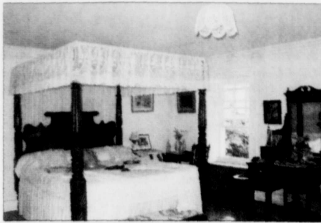
L'intérieur du Domaine Sunbury, une des dernières maisons de planteurs de la Barbade.