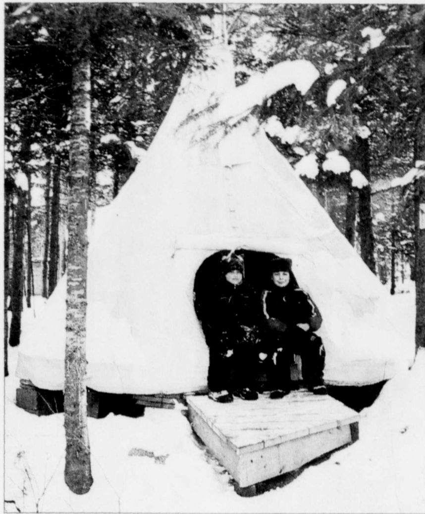
Camping traditionnel en été, le camping polaire de Saint-Léonard, à proximité du lac Simon, peut accueillir une vingtaine de visiteurs, qui dorment dans des tentes polaires chauffées, mais aussi dans des tipis et dans des igloos.

Ceux qui veulent faire revivre leur côté coureur des bois peuvent opter pour le tipi, muni également d'un poêle à combustion lente. Quant aux plus téméraires, ils choisiront de dormir en igloo sur des lits parfumés d'une odeur de sapin, à une température constante d'environ -4°C. Difficile, la nuit en igloo? « L'important, explique M. Dufresne, est de prendre un bon repas avant de s'endormir. Et de prévoir... bien entendu, afin de ne pas avoir à se lever en pleine nuit. » La porte d'entrée de l'igloo est si petite! Heureusement, les installations sani-