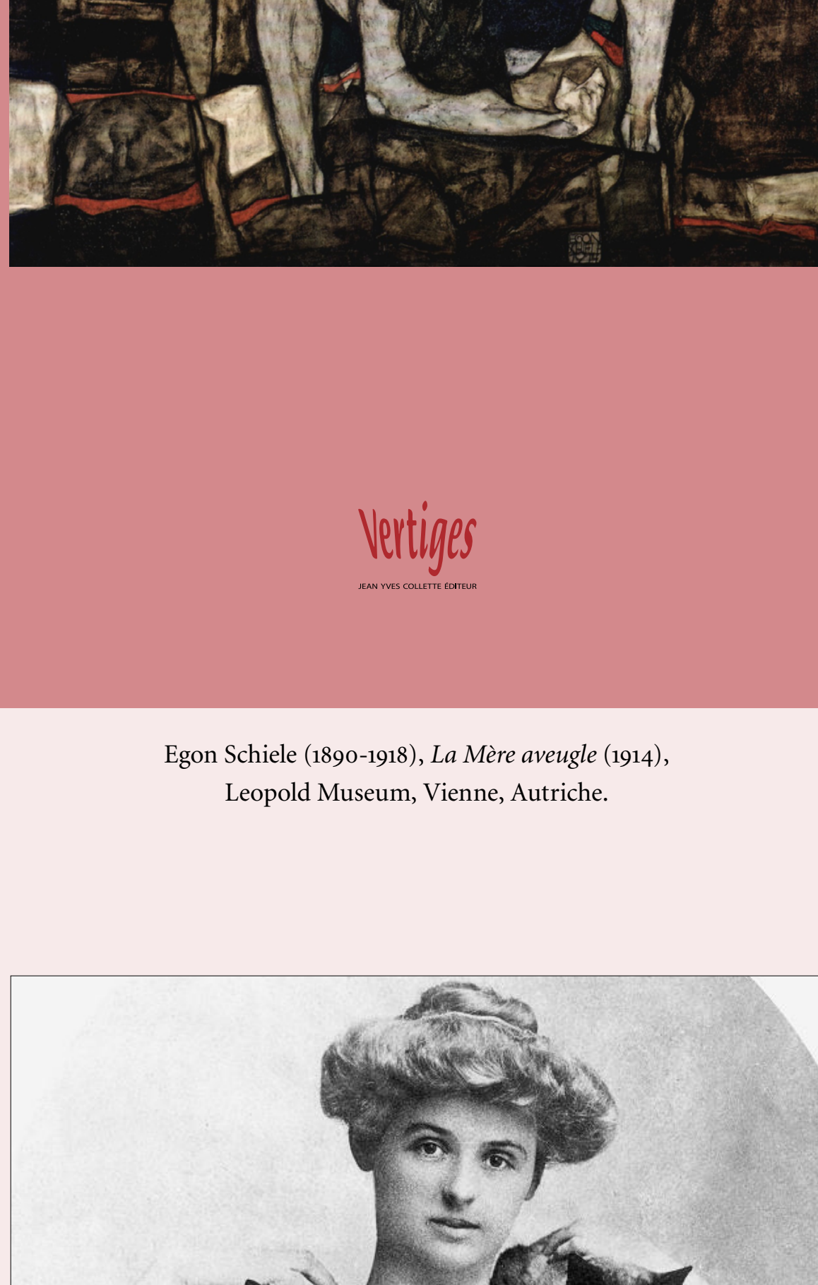
Egon Schiele (1890-1918), La Mère aveugle (1914), Leopold Museum, Vienne, Autriche.