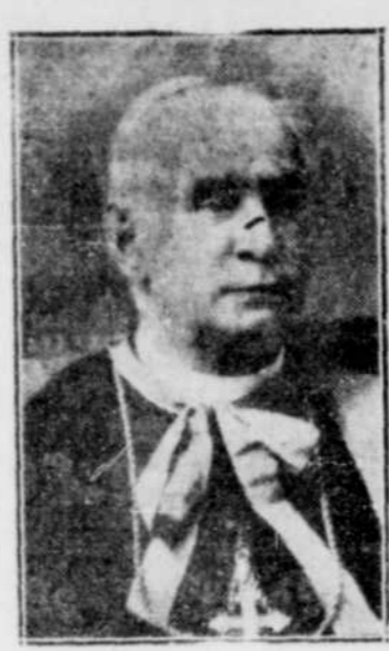
Son Exc. Mgr J.-H.-S. BRUNAULT, deuxième évêque de Nicolet, qui a célébré le 31ème anniversaire de sa consécration épiscopale la semaine dernière.