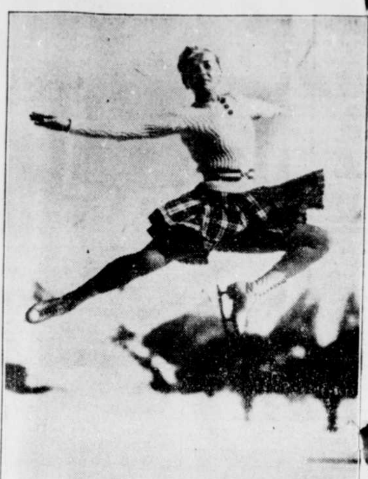
Max HERBER, championne patineuse d'Allemagne, qui a charmé les enthousiastes Canadiens, l'an dernier, par ses exhibitions en pratiquant à Gernisch Parties kirchen, pour les Olympiades.

méro des patineurs de fantaisie qui représenteront les Etats-Unis aux olympiades et la présentation de toute l'équipe américaine d'hiver qui participera aux olympiades