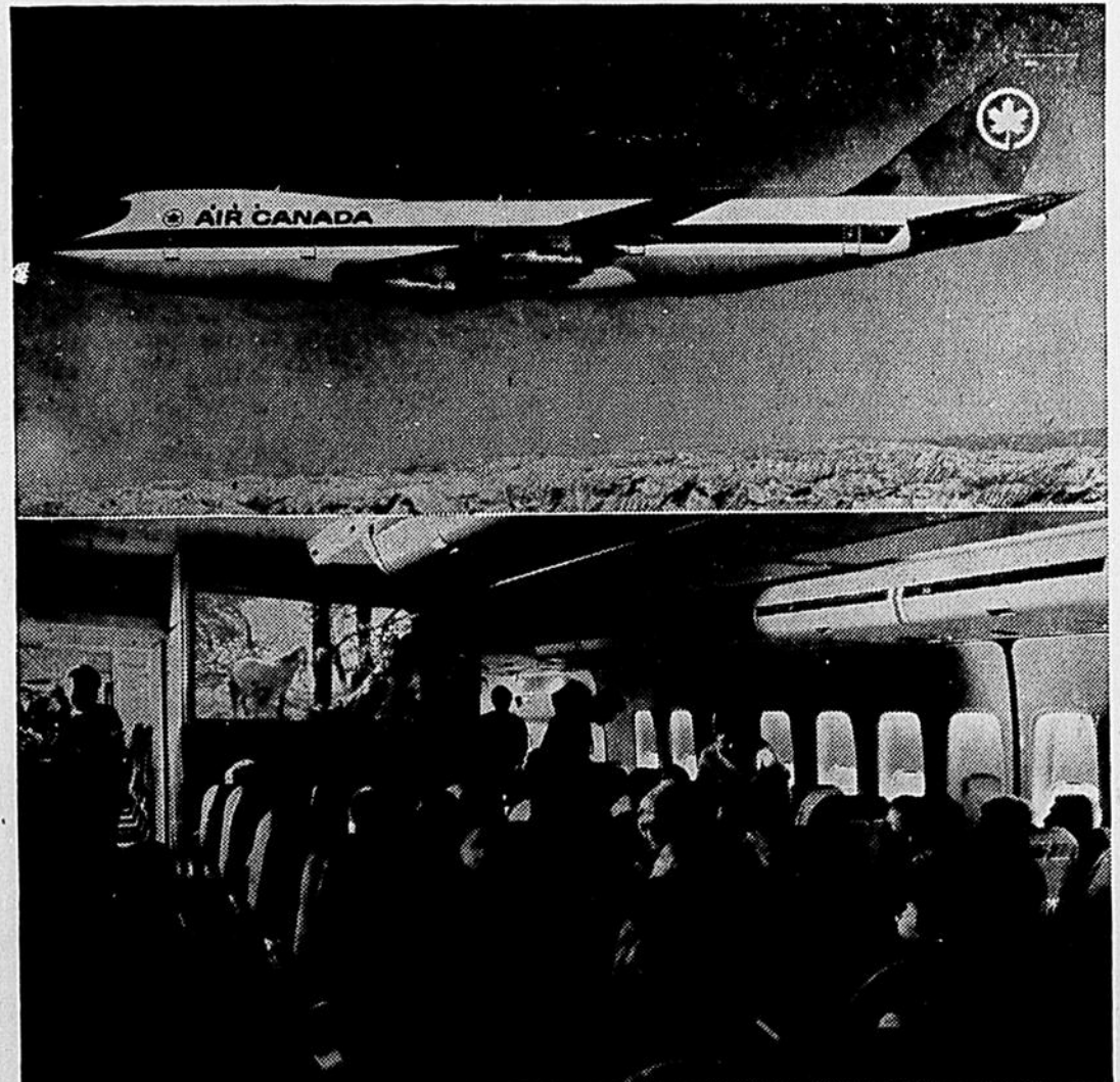
GRAND LUXE AU-DESSUS DES NUAGES —Air Canada vient de prendre livraison du premier de trois long-courriers Boeing 747, qui peuvent transporter 365 passagers dans un décor de grand luxe. A bord des 747 d'Air Canada, les passagers pourront voir des films ou écouter de la musique stéréo. Ce sera la première fois qu'un transporteur canadien offrira ce genre de divertissements. La Société recevra deux autres 747 ce printemps. Elle affectera le premier à la liaison régulière Vancouver-Toronto le 25 avril.