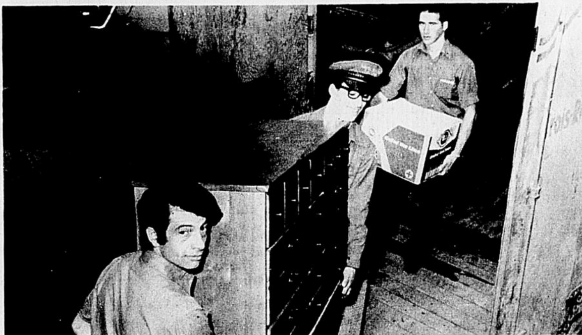
Traditionnellement le mois de mai est celui des déménagements. Dans la région immédiate, on calcule qu'au moins 2,500 locataires ont transporté leurs pénates. Sur la photo, nous voyons des employés dynamiques et spécialistes dans ce domaine, de la Firme Trifluvienne Martel Ex-

press, effectuant une phase de leur travail qu'ils ont effectué à maintes reprises, tout au cours de cette vaste opération annuelle faisant le bonheur des uns et le malheur des autres.