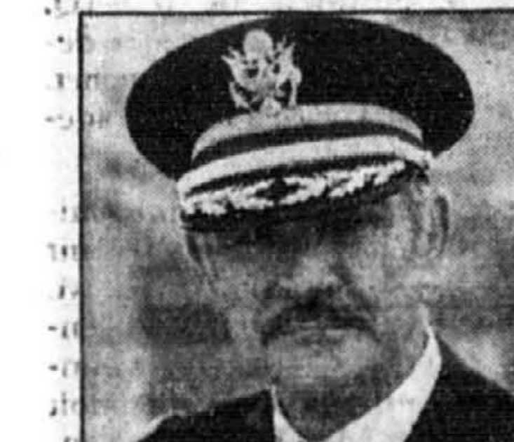
Sean Connery dans Presidio

1:00 16 - Jeux de guerre Un jeune crack de l'informatique entre dans l'ordinateur de la défense américaine. A sa sortie en 1983, ce film était prémoniteur.