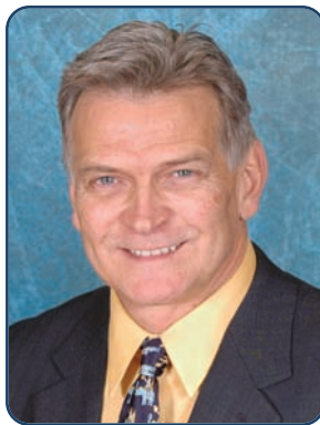
Roland Charbonneau Préfet de la MRC de La Rivière-du-Nord et maire de Saint-Colomban