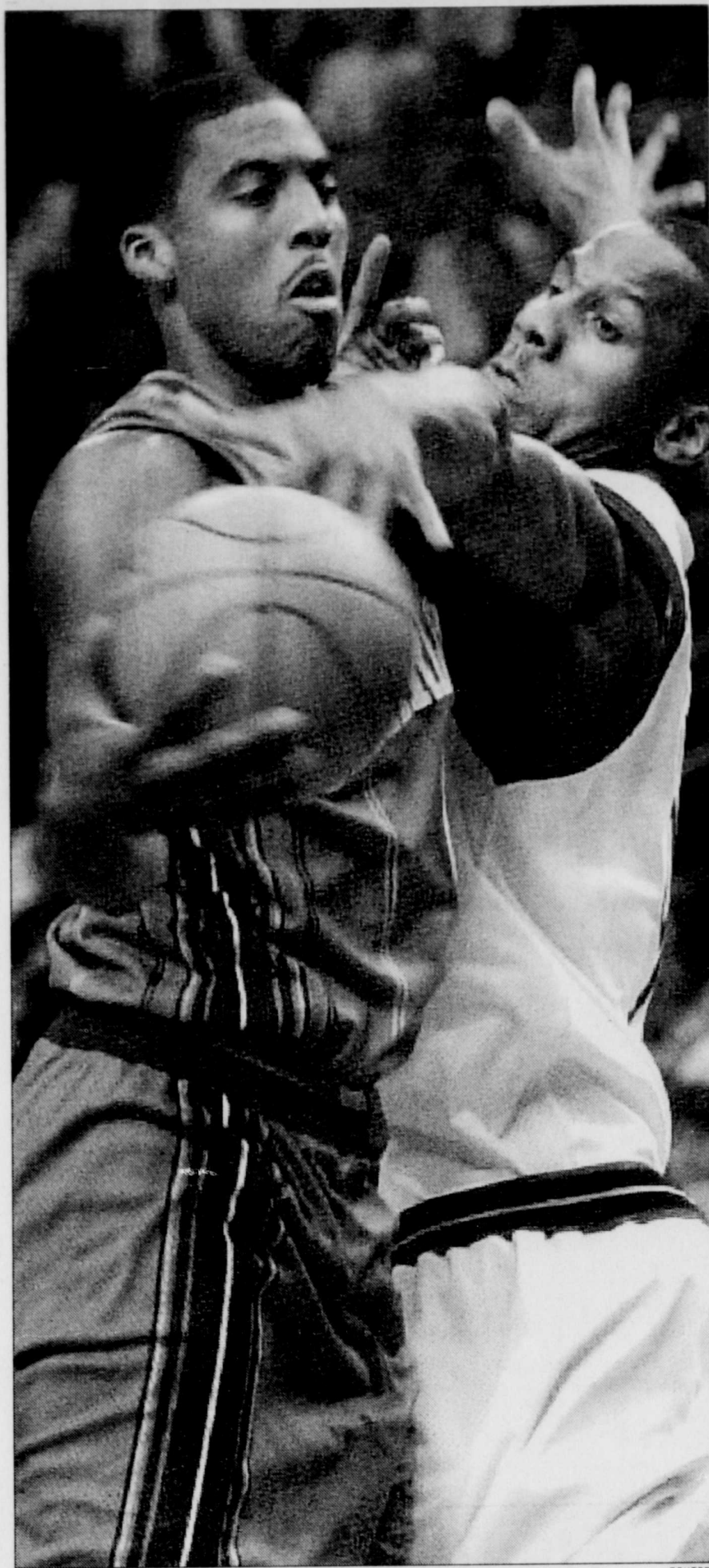
Eddie Jones, des Hornets de Charlotte, tente de se débarrasser de George Lynch, des 76ers de Philadelphie, au cours du quatrième match opposant les deux équipes dans une des séries éliminatoires de l'Association Est de la NBA. Charlotte a perdu le match 99 à 105 et Philadelphie a gagné la série 3-1.