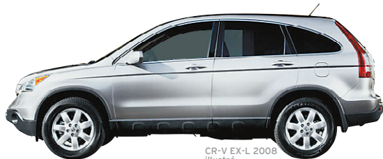
CR-V EX-L 2008 illustré