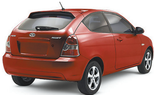
(MODÈLE ACCENT GL 3 PORTES SPORT MONTRÉ)* ACCENT L 3 PORTES 2008 transmission manuelle