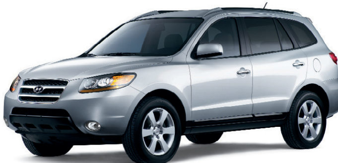
(MODÈLE SANTA FE LIMITED 7 PASSAGERS MONTRÉ)*

** Distance approximative basée sur une consommation sur autoroute.