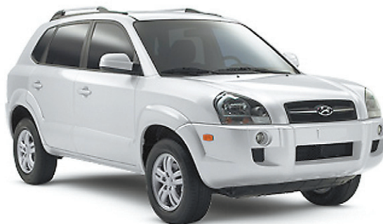
(MODÈLE TUCSON LIMITED MONTRÉ)*

Moteur 16 soupapes à DACT et CVVT • Deux coussins gonflables frontaux • Verrouillage électriques des portières • Dossier arrière rabattable 60/40 • Antenne intégrée au pare-brise • Volant inclinable • Système de filtration de l'air de l'habitacle