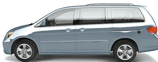
Odyssey EX-L 2008 illustré