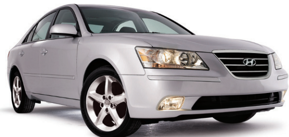
(MODÈLE SONATA GL V6 SPORT 2009 MONTRÉ)*

La plus faible consommation d'essence de sa catégorie***. Plus d'équipement de série que jamais. Un nouvel intérieur élégant. Le tout à un prix plus bas qu'auparavant.