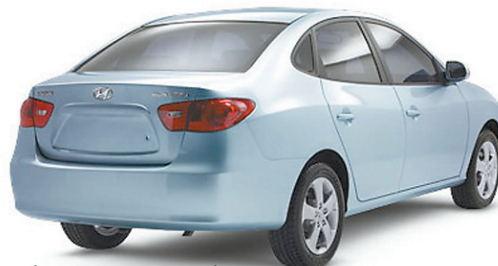
(MODÈLE ELANTRA LIMITED MONTRÉ)*

Moteur 16 soupapes à DACT et CVVT • Deux coussins gonflables frontaux • Verrouillage électriques des portières • Dossier arrière rabattable 60/40 • Antenne intégrée au pare-brise • Volant inclinable • Système de filtration de l'air de l'habitacle