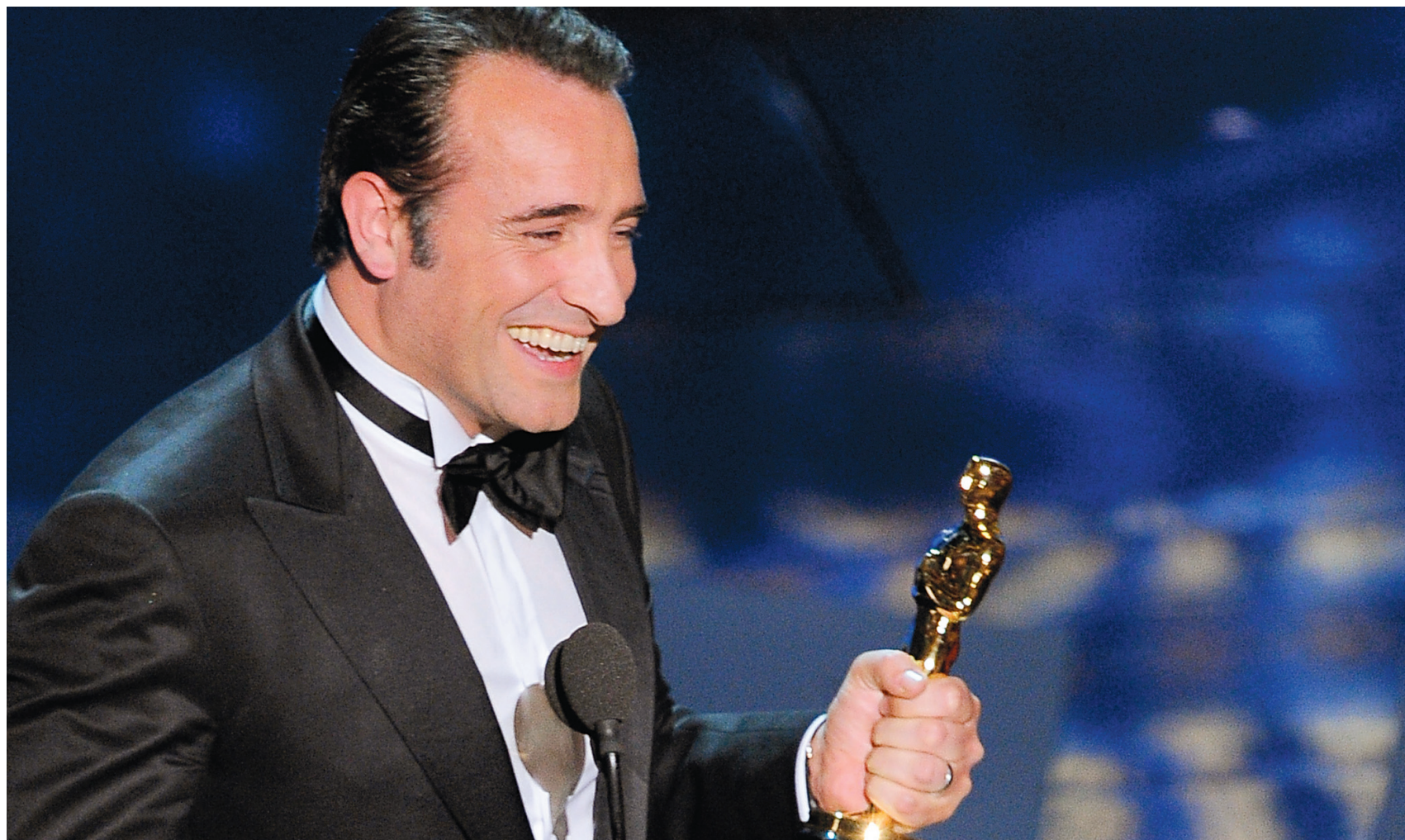
Le Français Jean Dujardin a été sacré meilleur acteur hier pour son rôle dans The Artist . «Merci! Formidable!», a-t-il lancé, guilleret.