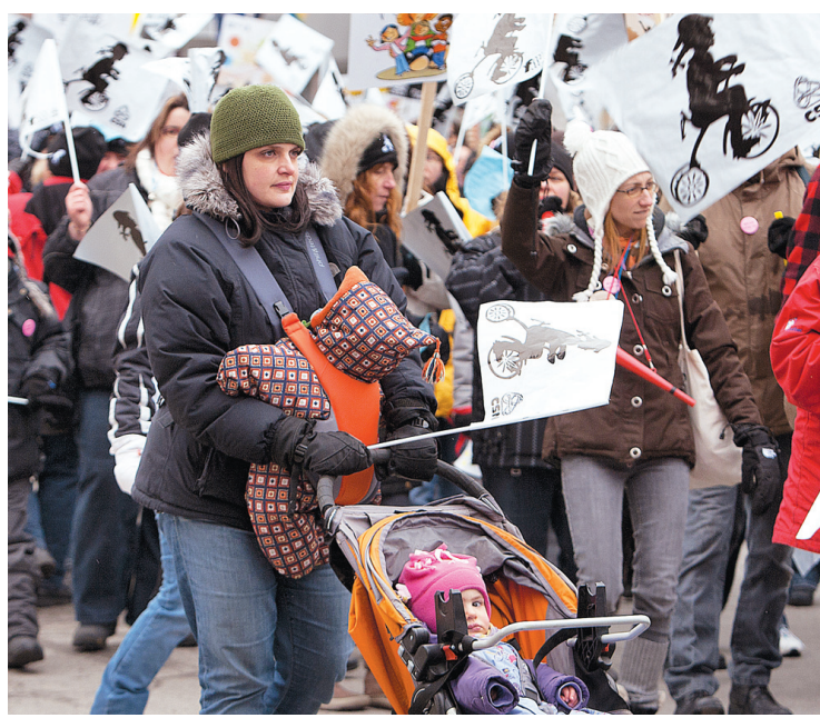
Des centaines d'employés de CPE avaient défilé dans les rues de Montréal, le 15 février dernier, dans le cadre d'une journée de grève.

L'entente de principe prévoit en outre une augmentation de la contribution gouvernementale au régime d'assurance collective afin de pallier le retrait des employeurs à ce