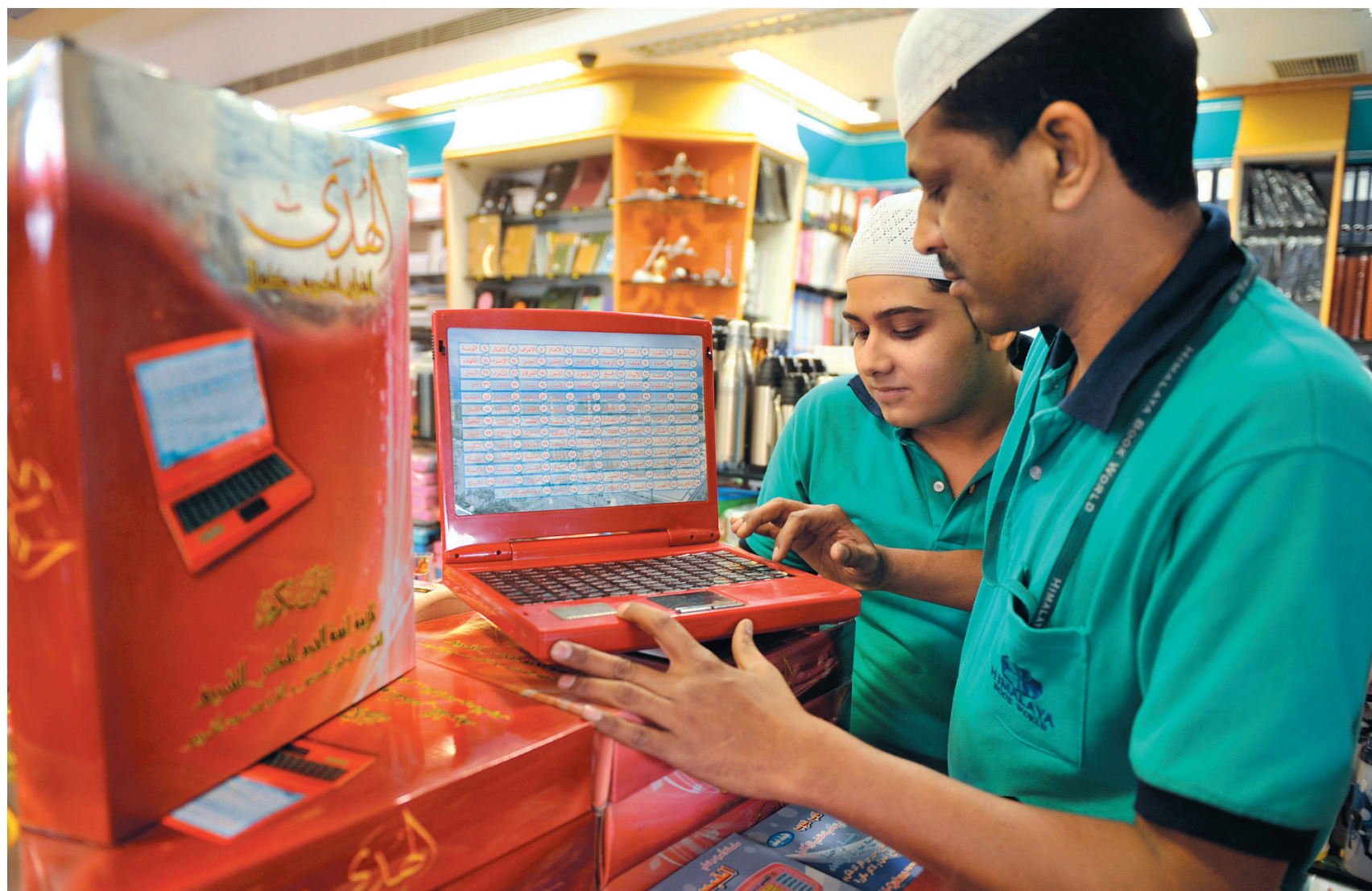
Deux employés d'un commerce indien consultent un chapitre du Coran sur un ordinateur portable dédié à la foi islamiste. L'appareil permet aux pratiquants branchés de consulter le livre sacré sans aucune autre distraction, puisqu'il ne renferme aucun autre logiciel.

Contrairement à ce que disent les tenants du clash des civilisations, nous continuons d'observer, en Europe et dans les pays musulmans, l'émergence et la consolidation d'une nouvelle culture détachée de la culture «islamique dure». Une nouvelle culture qui s'affirme, entre autres, par un sortir «islamiquement cool» qui se développe en se diversifiant: sketches, concerts, défilés de mode, théâtres et festivals islamiques nouveau genre. Car même si nous assistons à une réislamisation dans les sociétés musulmanes, cette ferveur a su renégocier une autre orientation.