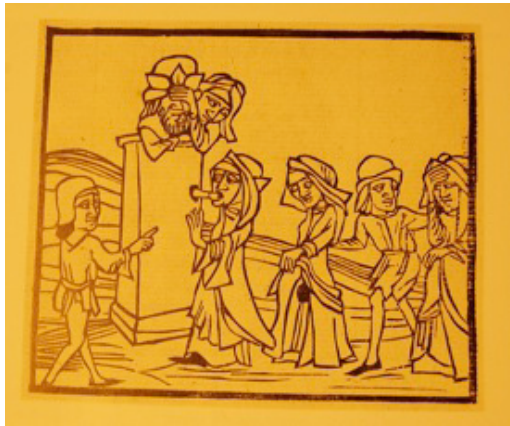
Figure 2. Maître E.R., gravure sur bois

Maintenant, voici une image sans le texte qu'elle est censée illustrer. Ce texte est non encore traduit en français parce qu'introuvable, l'image ayant été extirpée de son contexte par des collectionneurs d'estampes. Précédemment, dans le cas d'Aretino, nous avons perdu les peintures de Claudio Romano et les cuivres de Raimondi : ici, c'est le texte qui a disparu.