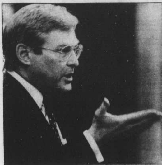
Le ministre des Finances, M. Michael Wilson