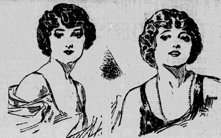
Quand les dents sont sales Quand les dents brillent