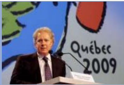
Le premier ministre, M. Jean Charest, est venu clore le Symposium.