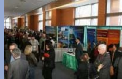
Le Salon des exposants, tenu en parallèle du Symposium, a attiré bien des participants.