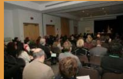
Six ateliers, ayant pour thème principal le développement d'une destination touristique durable, ont été présentés durant la première journée.

Chaque jour, des conférenciers de renom sont venus proposer autant des solutions concrètes que des exemples de bonnes pratiques à adopter.