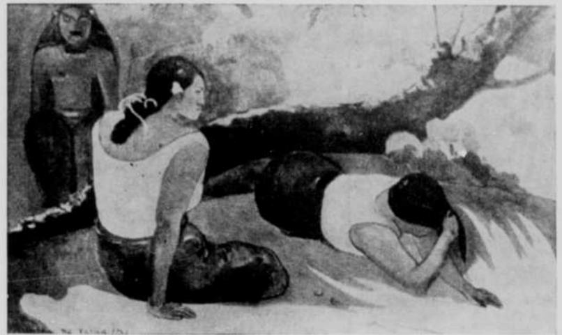
"La sieste" (vers 1894)

Nanti d'une solide situation, il épousa, en 1873, une jeune fille de famille