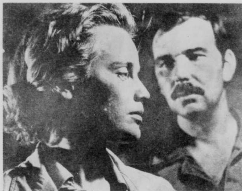
"Le dernier pont" au "Ciné-Club"