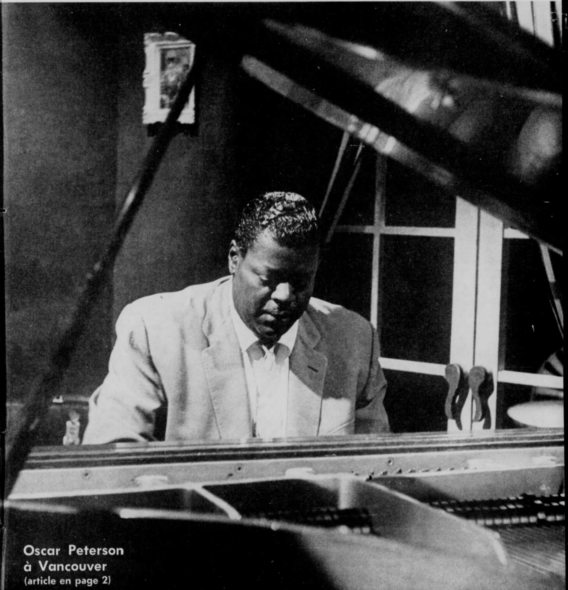
Oscar Peterson à Vancouver (article en page 2)