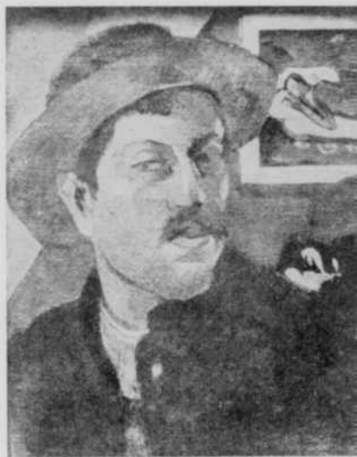
Auto-portrait (vers 1893) "L'esprit veille"

Malgré ces déceptions successives, il décide de se rendre à Tahiti à la poursuite de son éternelle chimère. Il n'y trouvera que la misère et finalement la mort. Mais il aura peint entre-temps ces toiles merveilleuses qui ont rapporté la célébrité à leur auteur et la richesse... aux autres.