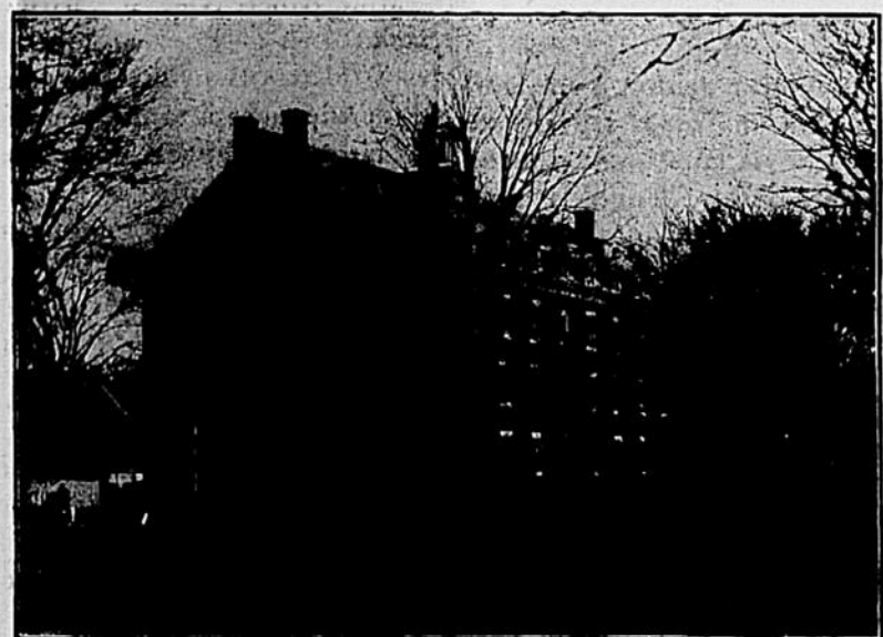
Couvent de N.-D. de Lorette