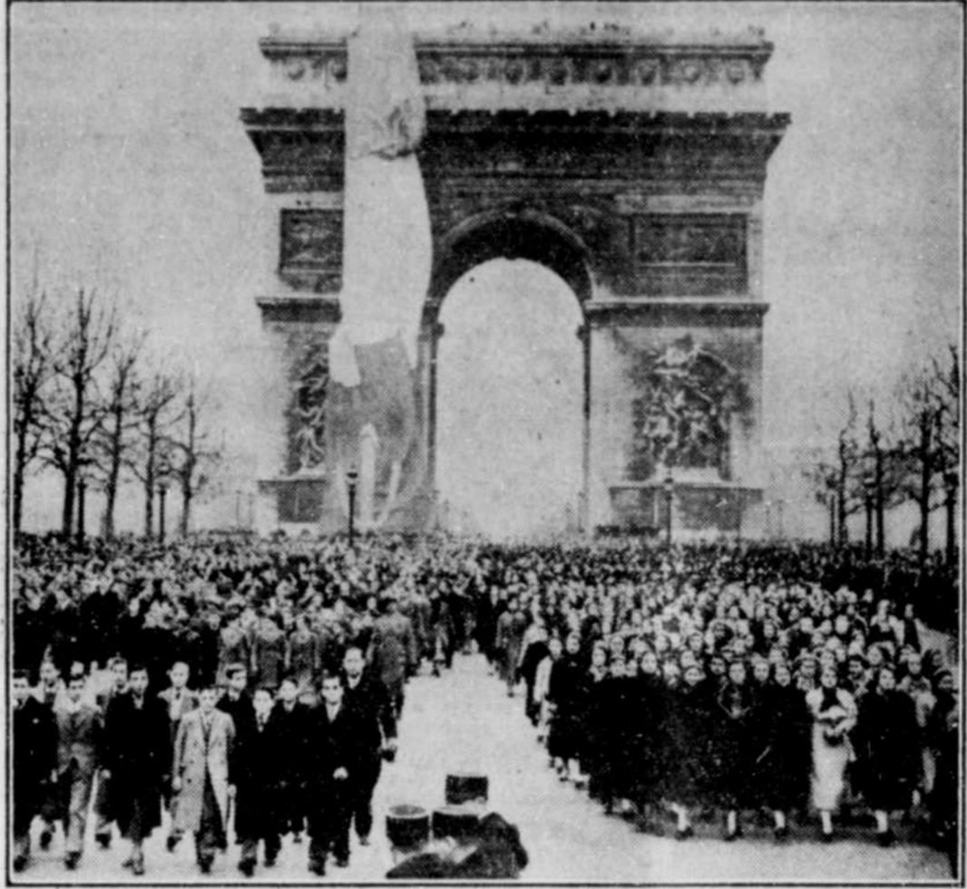
Voici des milliers d'écouliers et d'écoulières d'ilant par les Champs élysées pendant les manifestations du jour de l'Armistice dans la capitale française. En arrière: l'Arc de Triomphe.