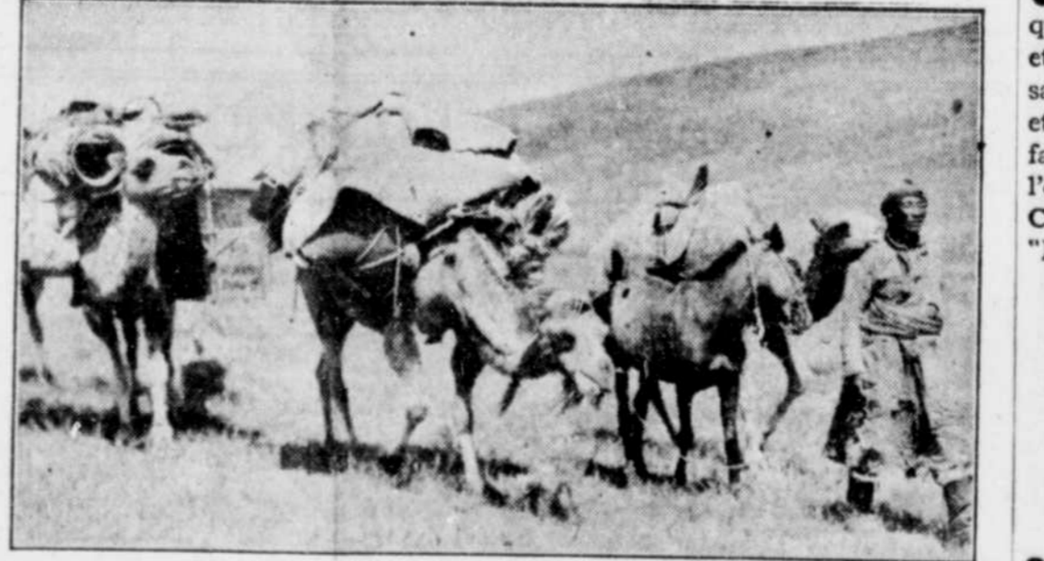
Les chameaux, les bouffes et les chevaux sont encore les principaux agents de locomotion dans la Mongolie intérieure où les Japonais se proposent de construire un chemin de fer pour fins stratégiques. Le roi de nom, le prince Teh, a reçu en cadeau des Japonais un aéroplane qui conduit pour lui un pilote japonais.