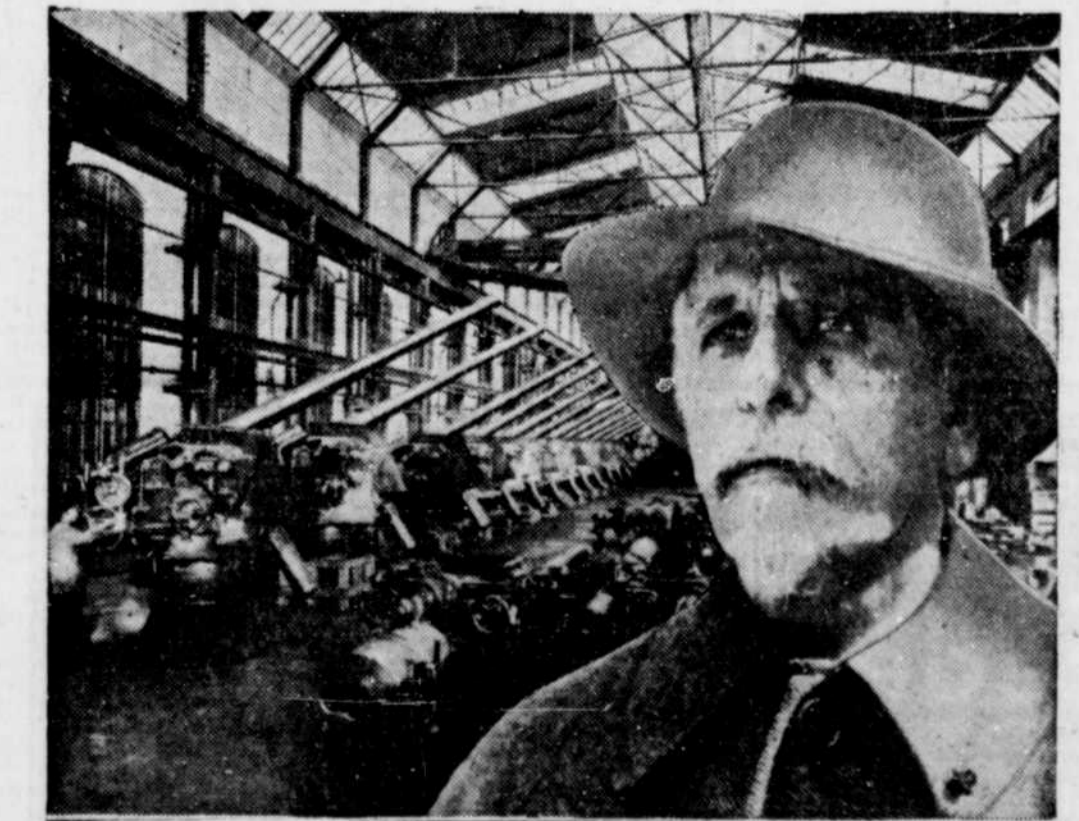
Sir Basil ZAHAROFF, celui qu'on appelait l'homme-mystère de l'Europe et qui s'est amassé une fortune fabuleuse en vendant pendant plus d'une demi-siècle des engins de guerre et des munitions à tous les pays qui pouvaient en acheter, vient de mourir à Monte Carlo. Il était âgé de 86 ans et c'était l'un des hommes les plus riches du monde.