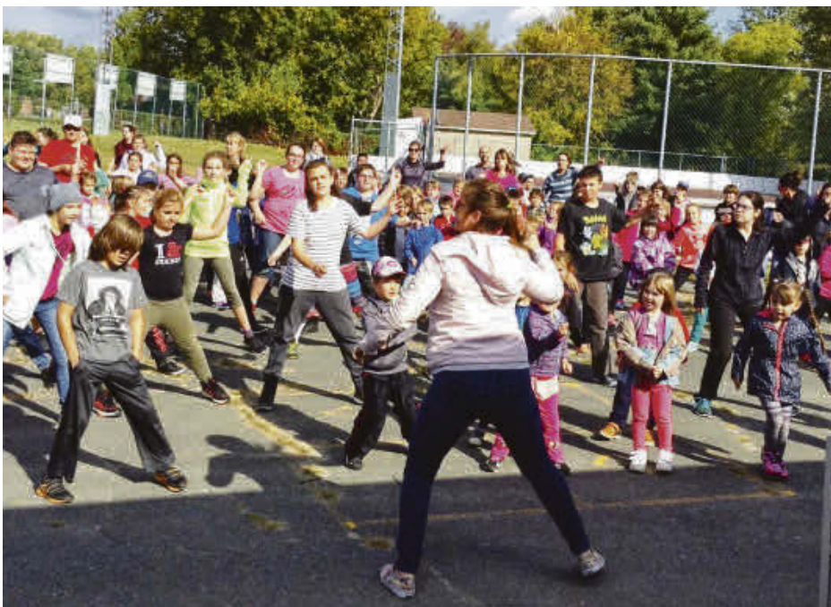
À l'école Saint-Jean-Baptiste de Roxton Falls, tout est prétexte à bouger et à tout moment de l'année.

La municipalité de Roxton Falls a avisé la population qu'aucune circulation ne sera possible lors de la course soit approximativement entre 9 h 30 et 12 h 15.