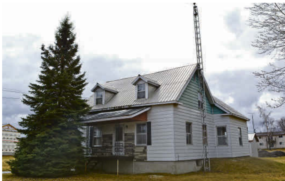
Le Service de sécurité incendie d'Acton Vale tiendra, ce samedi 28 avril, une pratique d'envergure dans une résidence de la rue d'Acton.

La pratique sera remise au lendemain si les vents sont trop forts.