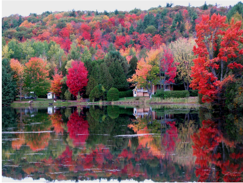
Daniel Matte (Repentigny) Reflet d'automne sur la route 343, rue principale à Sainte-Marcelline.