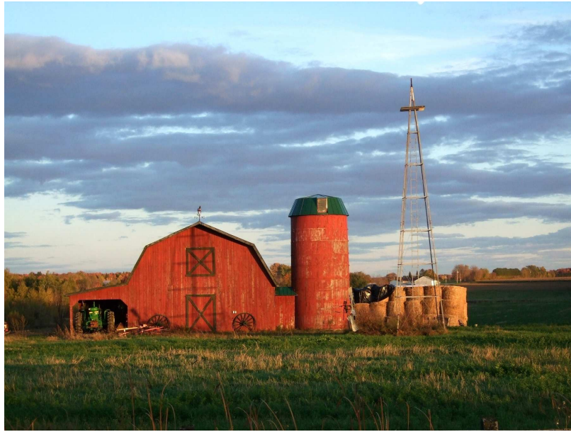
Daniel Matte (Repentigny). Belle d'autrefois au coucher du soleil, rang Pointe-du-Jour nord, le 10 octobre. Concours de photographies organisé par le Concours littéraire de Lanaudière 2010, mention.