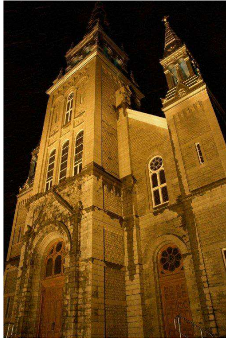
La cathédrale Saint-Charles-Borromée, Joliette. Concours de photographies organisé par le Concours littéraire de Lanaudière 2010, mention.