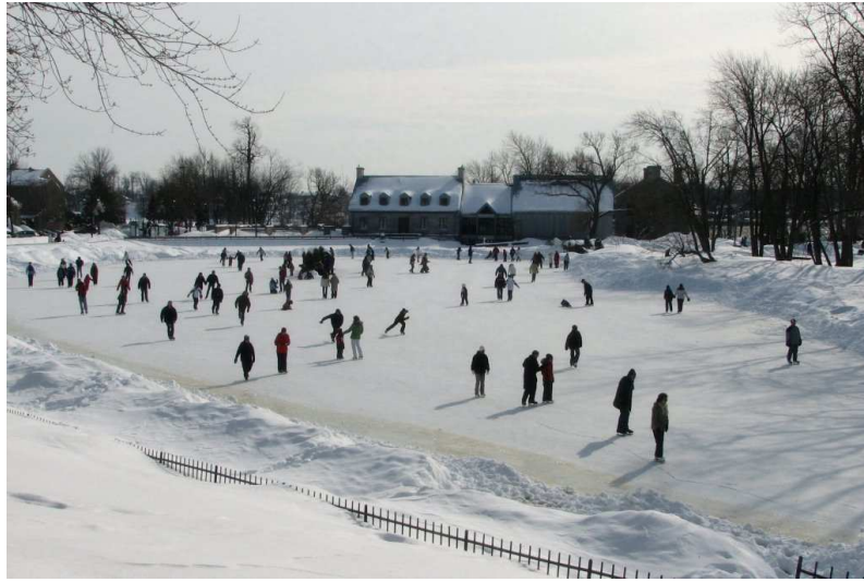
Photo : Kevin Gougeon (Mascouche), Patinoire, Parc de l'Île-des-Moulins, Terrebonne, deuxième site historique en importance au Québec. 3 e prix du Concours de photographies organisé par le Concours littéraire de Lanaudière 2010.