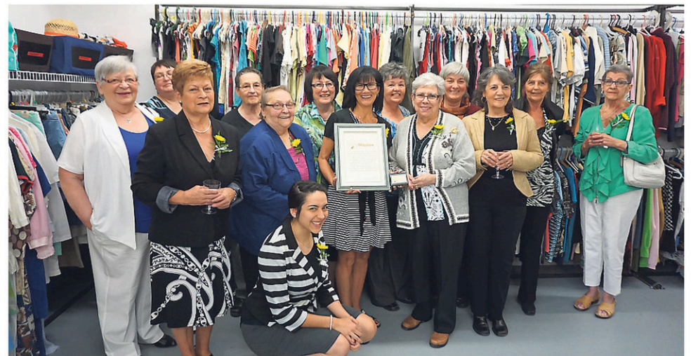
Plusieurs personnes se sont réunies pour l'inauguration des nouveaux locaux des Petites trouvailles récemment.

Pendant 26 ans, M me Maheux a donc déménagé sa friperie de logement en logement, allant même jusqu'à emprunter le domicile de Roxtonnais pour y poursuivre ses activités. C'est en 2009 que la municipalité a pris le comptoir familial en charge, lui créant une salle à l'étage de la caserne de pompiers. À peine un an plus tard, la bâtisse devenue désuète, a dû être détruite, cédant son emplacement à l'actuel Parc de l'oise blanche. Le comptoir familial a alors été relocalisé au presbytère, où se sont