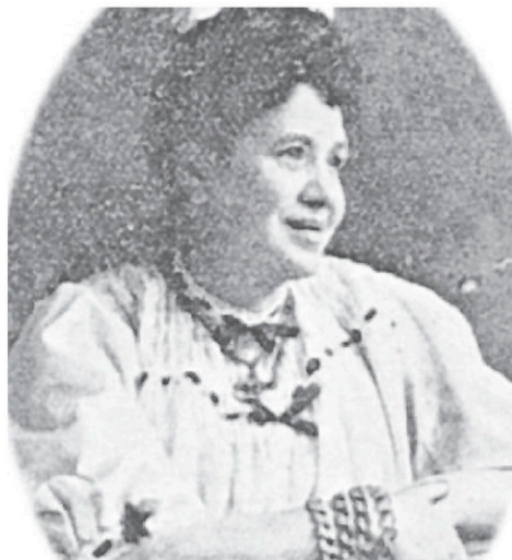
Une rare photo de la femme forte de Roxton Pond.

Au cimetière catholique de Roxton Pond, une tombe presque centenaire indique: