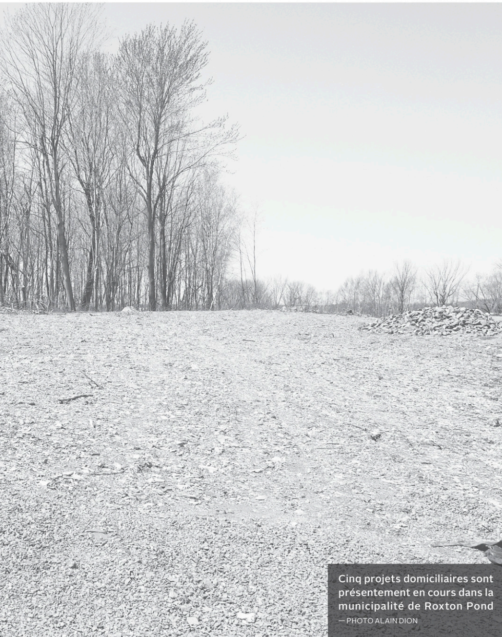
Cinq projets domiciliaires sont présentement en cours dans la municipalité de Roxton Pond