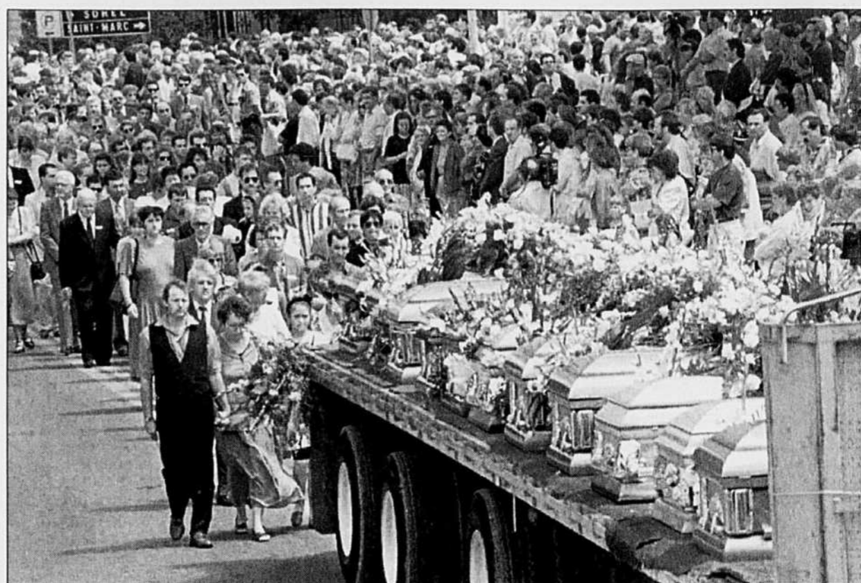
Environ 3000 personnes ont assisté hier à Verchères aux funérailles de 17 victimes de la tragédie routière du Lac-Bouchette.

Le licenciement massif et la perte extraordinaire mis à part, le programme de rationalisation prévoit la conclusion de la vente de la division STC Submarine Systems à la société française Alcatel Alsthom. En vertu de l'accord conclu entre les parties, Northern devrait récolter environ 900 millions$ US bruts.