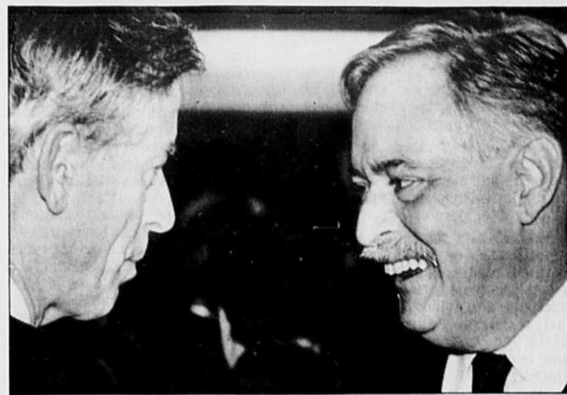
Jacques Parizeau a discuté avec Jean Campeau après son allocution.

À ce propos, M. Benoît Durocher, économiste à la Banque Royale, a rappelé que les investisseurs étrangers détenaient près de 270 milliards $ d'obligations canadiennes, soit un inventaire qui a d'autant plus de poids que l'épargne des Canadiens n'est pas suffisante pour absorber la dette du pays.