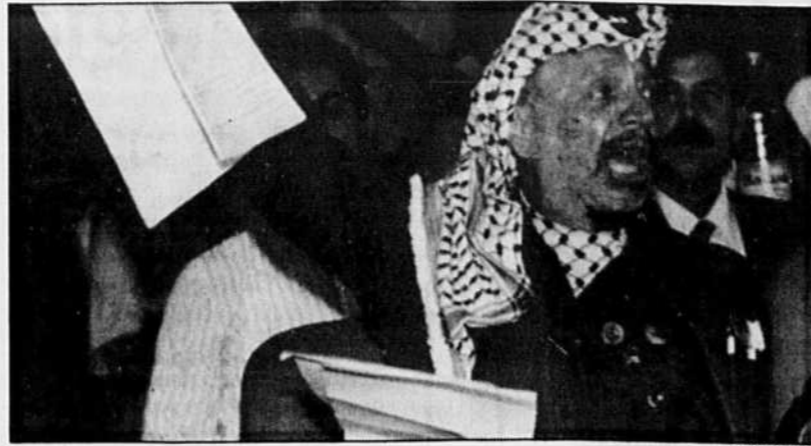
Yasser Arafat est sorti vivant d'un écrasement d'avion mercredi dans le désert libyen.

À Tunis, le quotidien Assabah estime que le chef de l'O.L.P. « sortira plus fort de cet accident ». La presse israélienne adopte une analyse similaire. « Si l'accident n'avait pas eu lieu, Arafat aurait dû inventer », selon Maariv qui estime que cette affaire « replace au centre de l'actualité internationale un homme dont le prestige avait considérablement diminué du fait de l'affaiblissement de l'Intifada et du blocage des négocia-