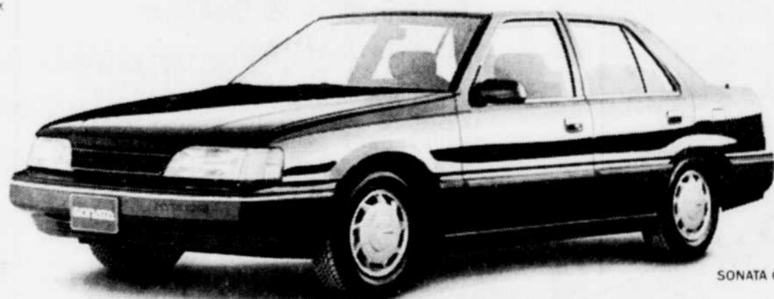
SONATA GLS 89