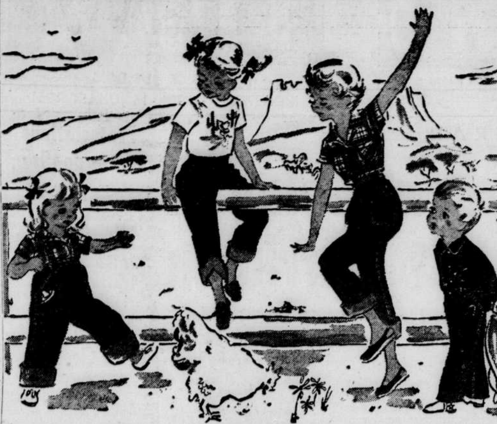
Ils seront en paix pour jouer et vous aussi pour les laisser prendre leurs ébats sur les clôtures ou en-dessous, s'ils sont munis d'habits de jeux solides et de teintes pas salissantes.