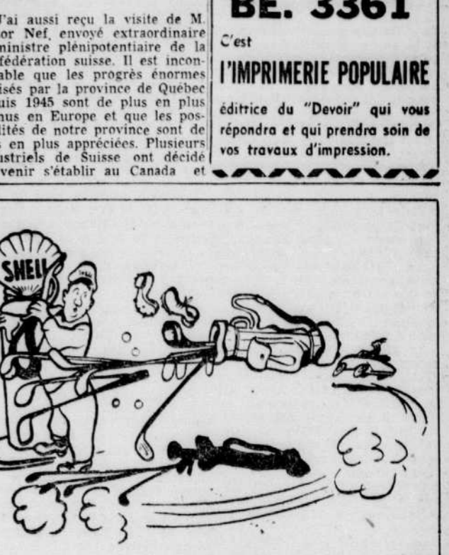
Achetez la Shell Premium 'Active' du détaillant Shell de votre voisinage. Et écoutez les Nouvelles Shell à 10:30 P.M. du lundi au vendredi, CKVL.

C'est l'IMPRIMERIE POPULAIRE éditrice du "Devoir" qui vous répondra et qui prendra soin de vos travaux d'impression.