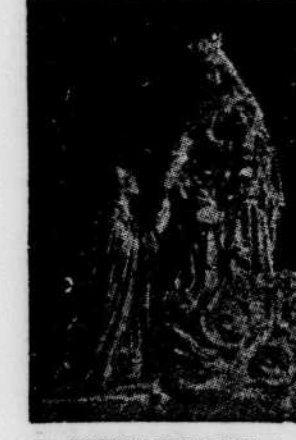
PRIERE EFFICACE A Marie, Reine des Coeurs

La reproduction de cette prière a été payée par un particulier de Montréal, en reconnaissance pour faveur obtenue de MARIE REINE DES COEURS, dont le sanctuaire est situé à St-Théodore de Chertsey, comté de Montcalm, avec promesse de publier dans l'espérance qu'elle bénirait d'autres.