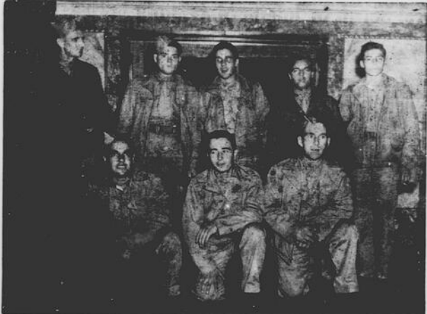
FINALMENTE IN CANADA — Dopo tre lunghi anni e mezzo passati nei campi di prigionie giapponesi, questi uomini del "Royal Rifles of Canada" arrivarono in Vancouver venerdì scorso. Quelli che incontrarono amici di Vancouver ebbero il permesso di avere passi per "dormire fuori". Prima di continuare il loro viaggio per casa essi riceveranno nuove "battedressa" canadesi.

Messina. — L'Assemblea dei sinistrati di guerra di Messina ha