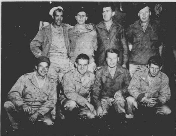
RIVE CANADESI IN VISTA — Felici sono questi otto membri del "Royal Rifles of Canada" mentre si avvicinavano alle rive canadesi a bordo di una nave americana, dopo quasi quattro anni di prigionia nei campi giapponesi.

6818 BOUL. ST-LAURENT Tel. CRescent 2621