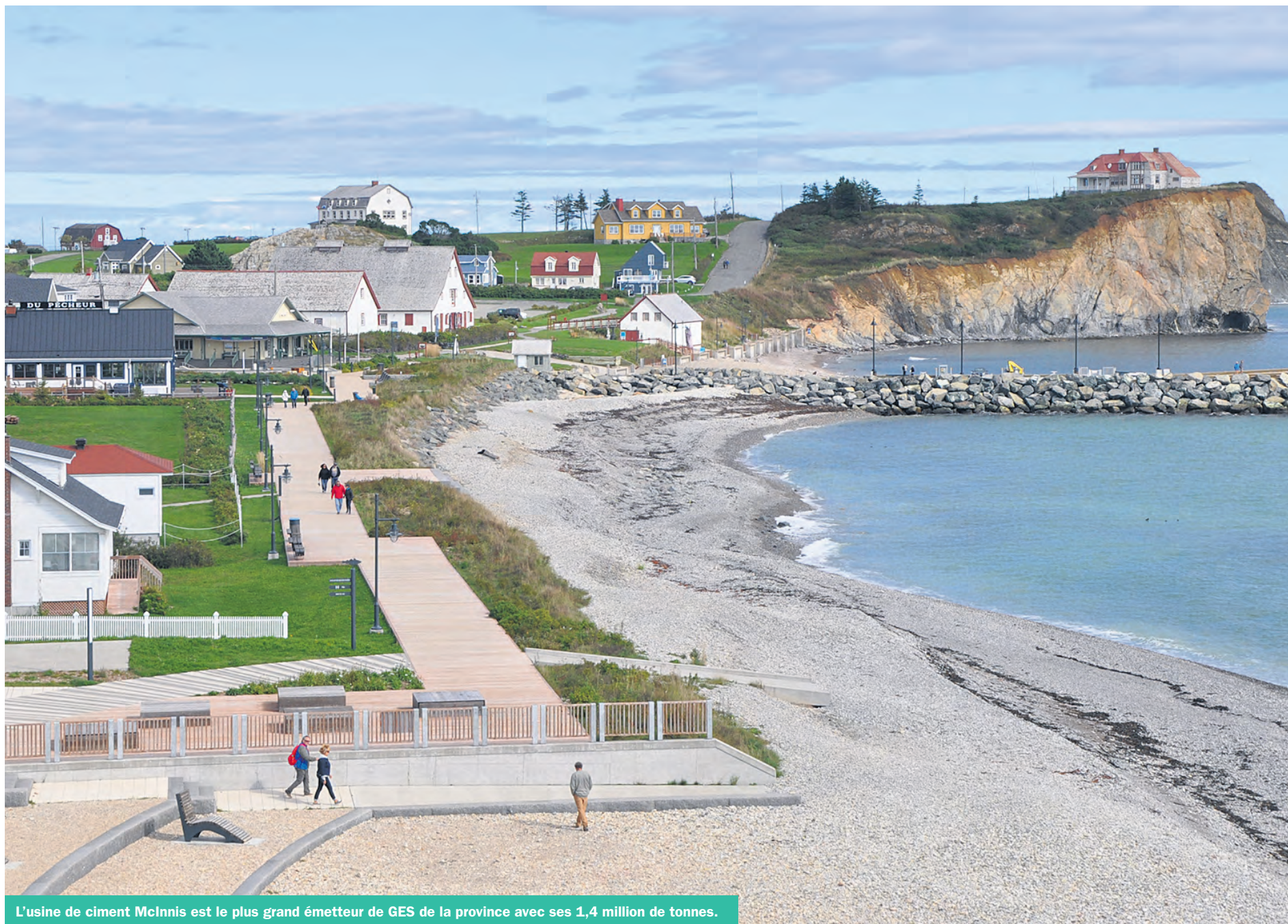
L'usine de ciment McInnis est le plus grand émetteur de GES de la province avec ses 1,4 million de tonnes.