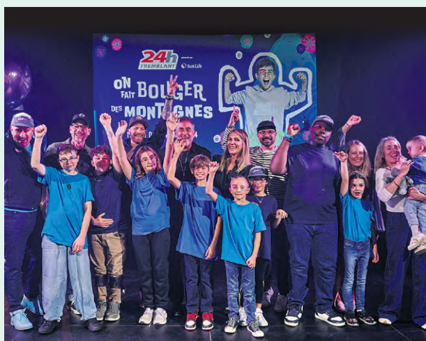
Plusieurs jeunes héros de cette 24 e édition du 24h Tremblant.

Comme à l'accoutumée, les nombreuses équipes composées de 6 à 12 membres se relayeront, jour et nuit, pendant 24 heures afin d'accumuler des fonds qui permettront de financer des projets essentiels et innovants soutenus par la Fondation Charles-Bruneau, la Fondation du CHEO, la Fondation CHU Sainte-Justine, la Fondation de l'Hôpital de Montréal pour enfants et la Fondation Tremblant.