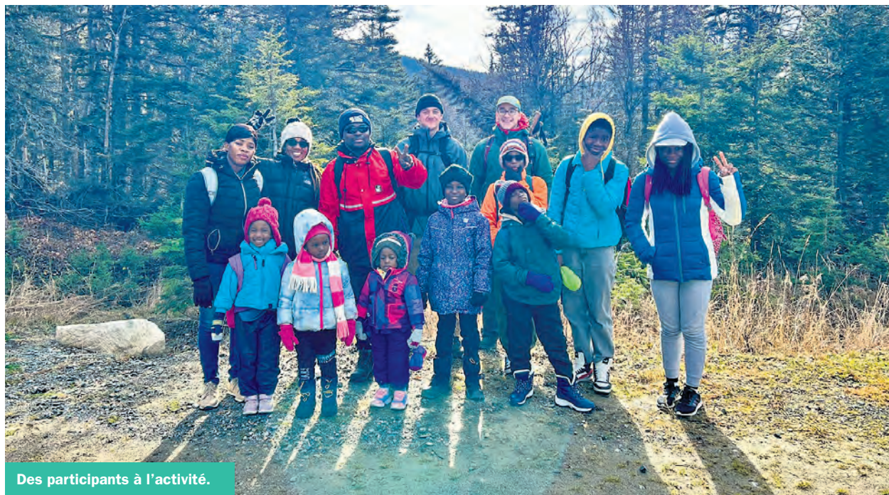
Des participants à l'activité.

Ces infirmiers et infirmières de profession ont déménagé en Gaspésie, en octobre 2023, avec leur famille pour se joindre aux équipes des centres hospitaliers de Maria, de Chandler, de Gaspé et de Sainte-Anne-des-Monts afin de répondre aux besoins de main-d'œuvre du CISSS de la Gaspésie. Plusieurs activités d'intégration leur ont été offertes au cours des derniers mois, mais il s'agit du premier rassemblement de toutes les personnes du projet.