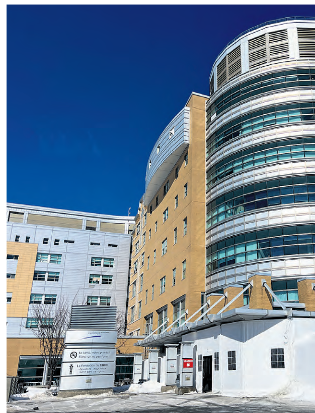
Le CISSS du Bas-Saint-Laurent a annoncé une abolition de 142 postes en mars.

« Au départ, il était annoncé qu'environ 140 postes allaient être coupés, mais au total, ce n'est pas ça du tout. Ce sont peut-être 140 coupés, mais beaucoup sont vacants. Dans notre accréditation syndicale, il y a sept postes où il y aura des supplantations. Ça pourrait être pire, mais ça amène son lot de stress et d'anxiété. Ça va aussi créer une surcharge de