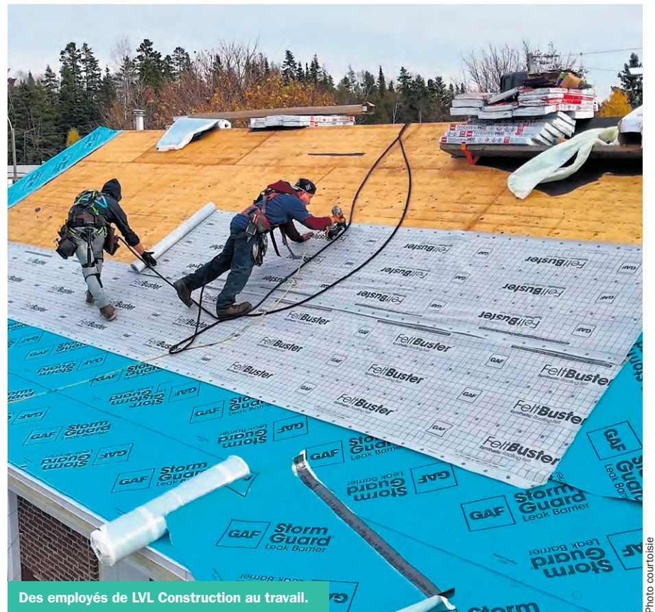
Des employés de LVL Construction au travail.