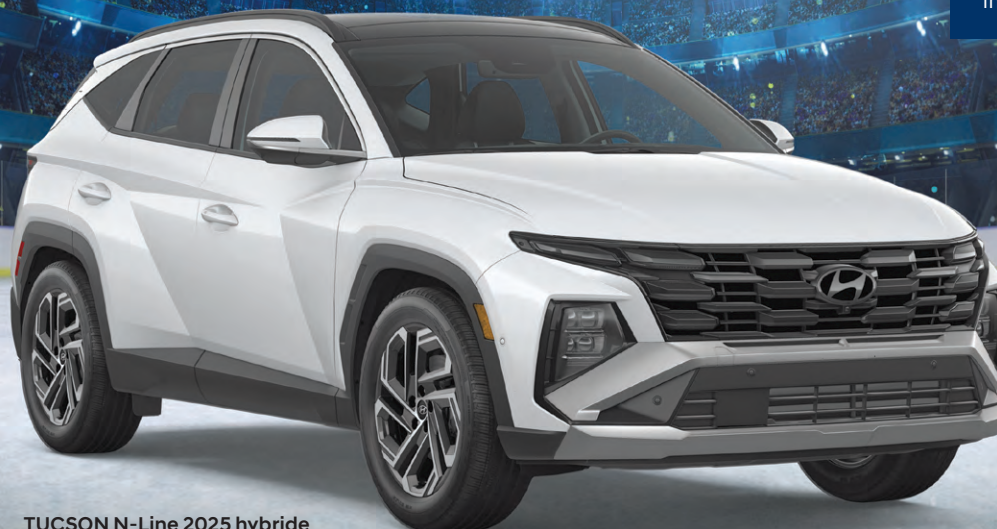
TUCSON N-Line 2025 hybride

Réduction de taux fidélité de 0,5% incluse pour les clients admissibles ‡ .