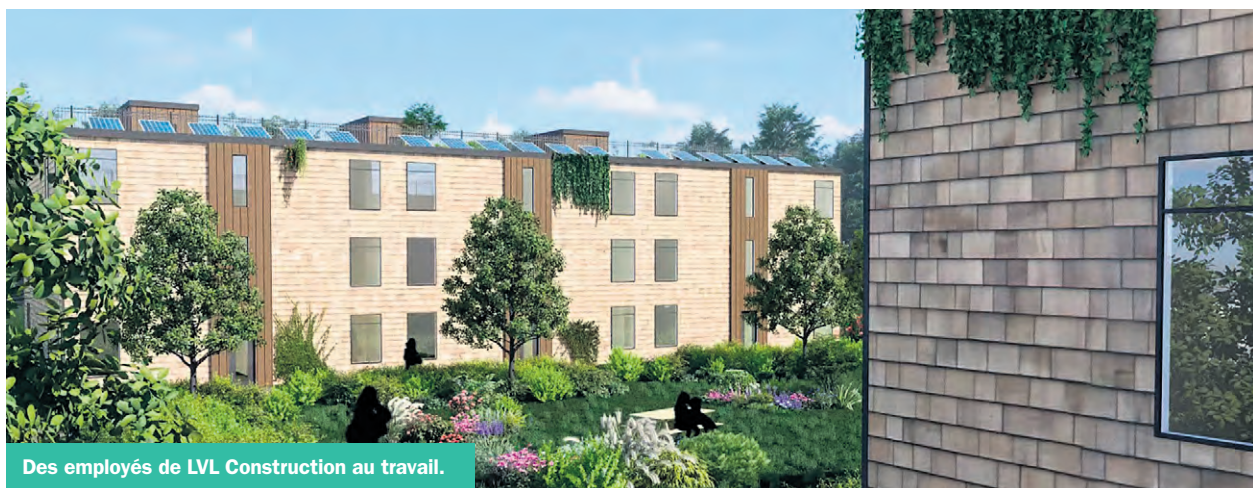
Des employés de LVL Construction au travail.

Du côté du comité de copilotage du projet d'Écoquartier de Rimouski, l'adjointe à la direction de CMétis rapporte qu'un courriel a été transmis à ses membres pour les rassurer. «C'est d'ailleurs ce courriel qui a initié la publication Facebook du 26 mars. Il avait pour but de rassu-