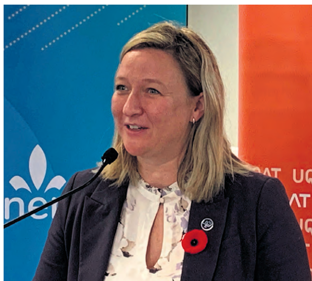
La députée de Rimouski et ministre des Ressources naturelles et des Forêts, Maité Blanchette Vézina.

Concernant la demande de la Régie de transport du Bas-Saint-Laurent d'imposer une taxe sur l'essence pour fi-