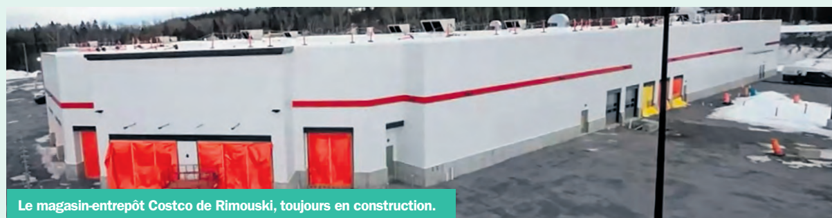
Le magasin-entrepôt Costco de Rimouski, toujours en construction.