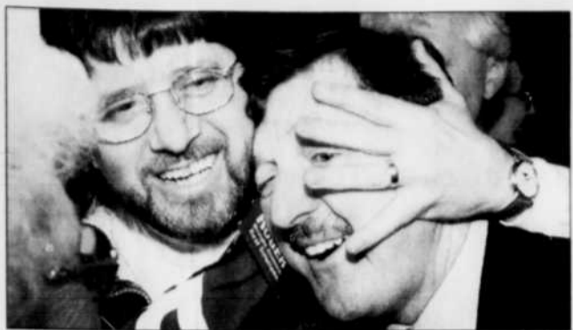
L'ex-ministre de la Santé a la réputation d'être un négociateur impitoyable