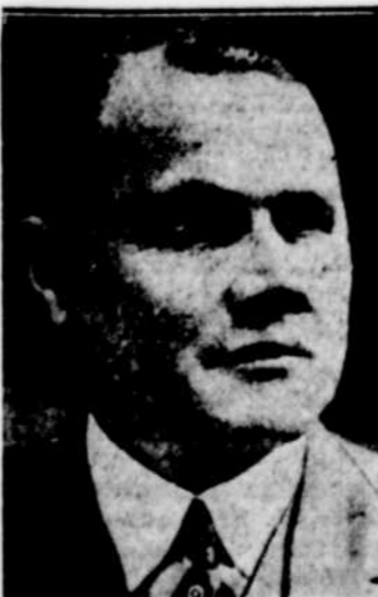
William GREEN, le président de la Fédération Américaine du Travail, a eu plusieurs entretiens, au cours de la semaine dernière, avec Joan-L. Lewis, le chef de la C.I.O., afin de trouver un moyen d'associer, dans un effort commun les deux grandes associations ouvrières d'outre-frontière. Apparemment, les deux chefs n'ont pu s'entendre.

En désaccord Londres, 7. (P.A.) — Alarmé par les lettres et les articles d'un caractère pessimiste, qui paraissent dans la presse britannique, relativement aux conditions économiques et sociales qui régissent dans l'ouest du Canada, le Haut-Commissariat canadien à Londres a pris des mesures pour réagir activement contre ces informations fausses. Nombre d'articles sont parus, dans plusieurs journaux quotidiens, et tous tendaient à exposer la situation des affaires, dans les provinces des Prairies. Les auteurs faisaient une peinture si sombre de l'état de choses, qu'ils laissaient parfois, l'impression que l'ouest entier était devenu une plaine aride et que la population sombrerait dans l'indifférence.